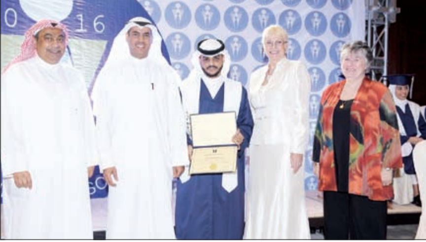
الجري والسهلاوي ومديرة المدرسة يكرمون أحد المتفوقين