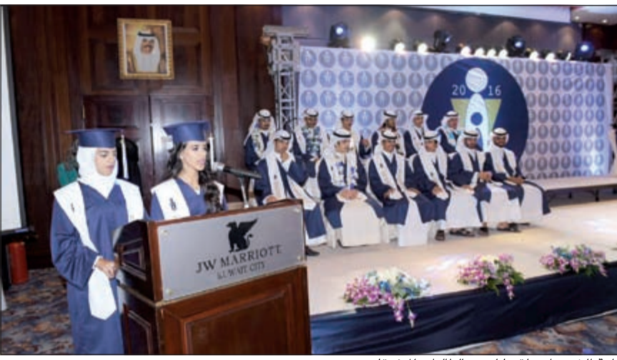
كلمة الخريجات تلقيها احدي الطالبات المتفوقات