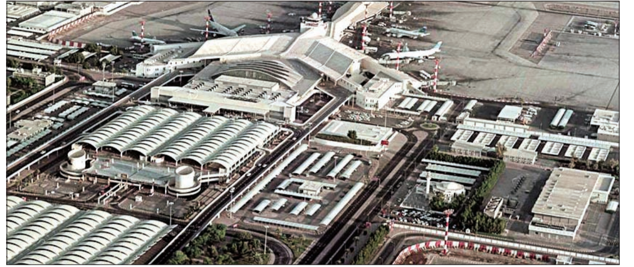
مبنى مطار الكويت الدولي من الجو