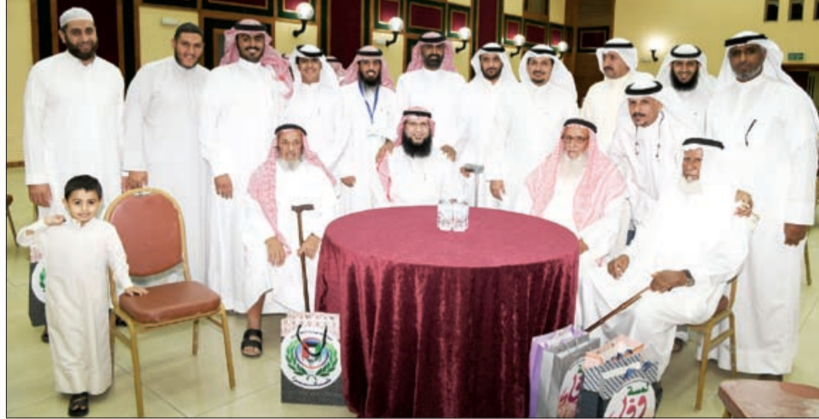
رئيس وأعضاء مجلس الإدارة مع مجموعة من المكرمين

آباءنا وامهاتنا. لافتا إلى أن النبي ﷺ قال «من أجل الله أكرام كل ذي شعبة في الإسلام وحامل القرآن كان يتم في السابق إعناق العبد إذا كبر في السن، وقد سئل النبي ﷺ عن الشيب فقال «هو نور المسلم»، وقال أيضا «من شاب في الإسلام شعبة كتب له كل يوم حسنة وحط عنه سيئة»، وقال مشيرا إلى أن جمعية علي صباح السالم مميزة من خلال برامجها والمسابقات التي تطلقها والخدمات والمهرجانات التسويقية ولن نرضى بأقل من هذا المستوى المتقدم.