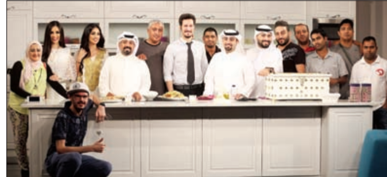
لقطة جماعية لفريق عمل برنامج «سيز علينا»