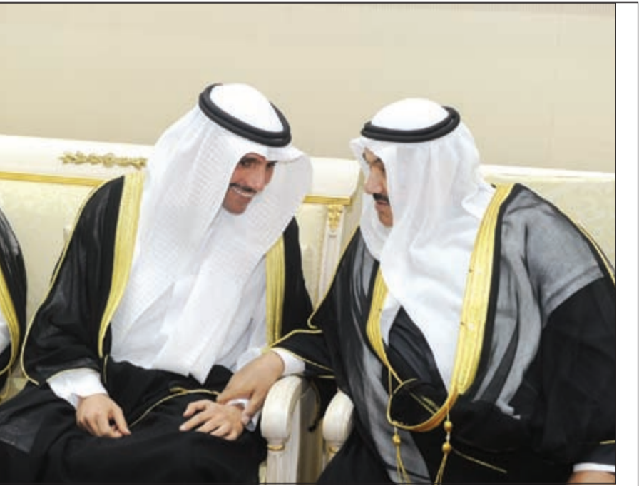
مرزوق الغانم في حديث مع سمو الشيخ ناصر المحمد

ناصر المحمد استقبال المهنيين بالشهر الفضيل 04 05