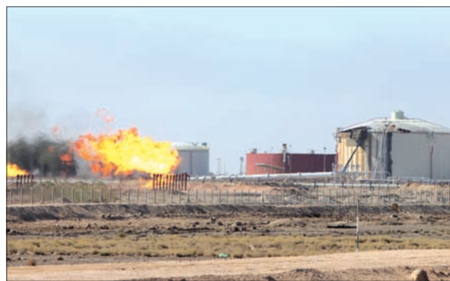
أسعار النفط تسجل مستويات قياسية في مايو مدعومة بتعطل الإمدادات في نيجيريا وتخفيض مستوى إنتاج النفط الرملي في كندا