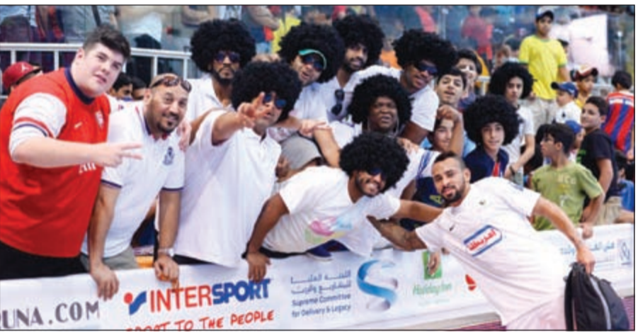
مباراة مميزة من عموري