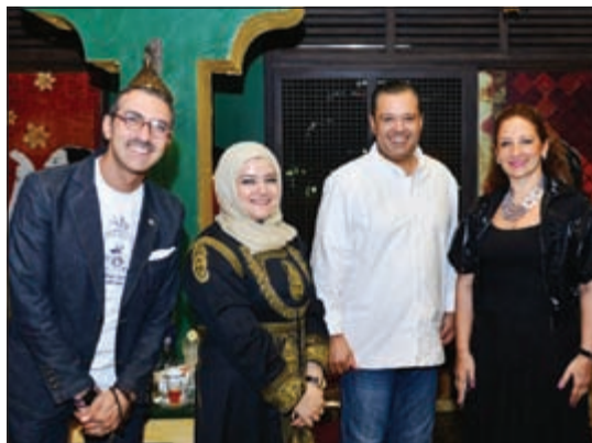
جانبا من الغبة

نظمت شركة تي أم سي سي للعلاقات العامة والاستشارات التسويقية للإعلاميين في الكويت حفل غبة رمضانية مستوحاة من معاني وتقاليد الشهر الفضيل، وذلك في مطعم أبو السيد. واستضافت الشركة لفيفا من الإعلاميين وسط أجواء رمضانية تميزت بتقدير كامل لجهود الإعلاميين ودعمهم