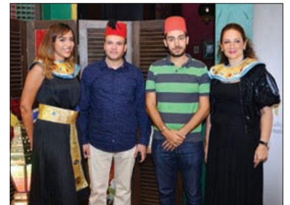
مشاركون في الغبة