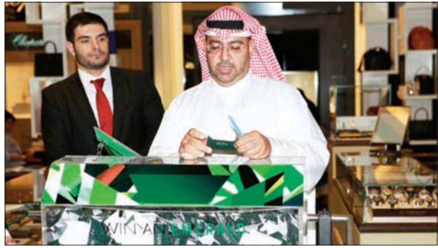
إعلان اسم الفائزة