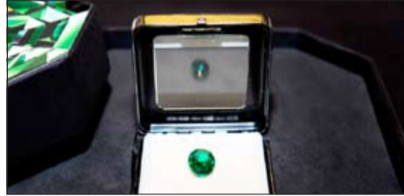
حجر الزمرد الكريم

تقديم جائزة قيمة مقابل مشربياتهم من معارضنا في الكويت. واختتمت الزراعي قائلة: إن هذا المهرجان ماهو إلا الخطوة الأولى في عدد من المفاصل اللاحقة التي نؤمن بانها ستجد استحساناً ورضا بين عملائنا فهم الأهم بالنسبة لنا.