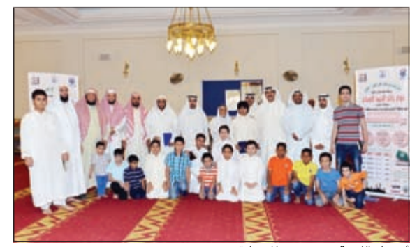
أعضاء اللجنة مع عدد من المتسابقين

انتهت أمس تصفيات المسابقة الرمضانية الثانية لحفظ وتجويد القرآن الكريم، التي تنظمها إدارة العلاقات الحكومية بمحافظة الأحمدية بالتعاون مع إدارة مساجد محافظة الأحمدية، وبرعاية المحافظ الشيخ فواز خالد الحمد تحت شعار «الأحمدي غير في شهر الخير». في هذا الإطار، أوضح مراقب إدارة العلاقات الحكومية بمحافظة الأحمدية وليد المطيري أن النسخة الثانية من المسابقة شهدت إقبالا لافتا، حيث وصل عدد المتقدمين إلى نحو 500 متسابق من أبناء محافظة الأحمدية في الفئات الثلاث والتي تشمل البراعم من 5 حتى 9 سنوات، والناشئة من 10 حتى 13 سنة، والشباب من 14 إلى 18 سنة. وأوضح المطيري أن مسابقة هذا العام تحظى باهتمام كبير من قبل المحافظ الشيخ فواز خالد الحمد والقائمين على إدارة قطاع المساجد بالمحافظة نظرا للنجاح الكبير الذي حققته