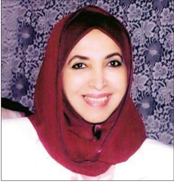
الشيخة د. سعاد الصباح