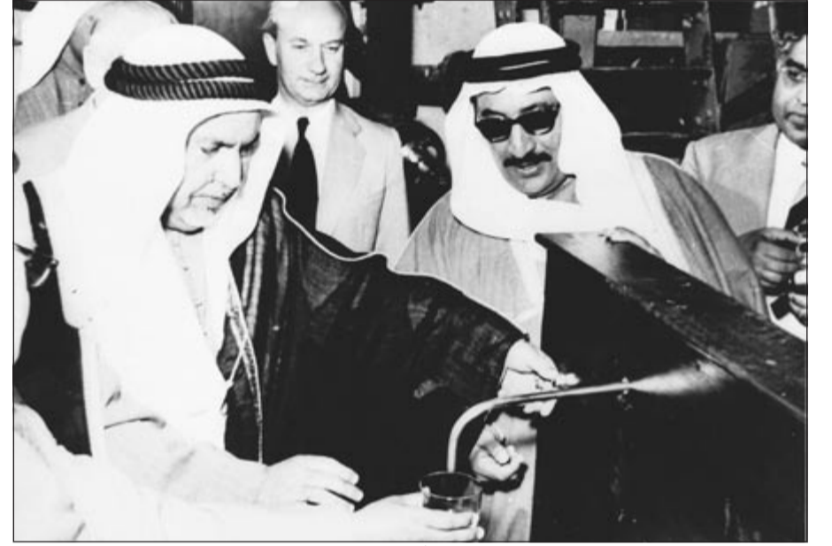
الشيخ عبدالله السالم والشيخ عبدالله المبارك بشربان من أول محطة لتحلية المياه بالكويت

معتدية، ومستعمرة ثم صديقة وحليفة.. في هذا الخضم من العلاقات المتشابكة والمعقدة، والأحداث الصغيرة والكبيرة، والاستقرار وعدم الاستقرار، والسلام والحروب، والرخاء والكساد، والهدوء والاضطراب.. في هذا المحيط الذي ليس له حدود تاريخية ذات نشأة بدوية بسيطة في حياة أمة صغيرة مسالمة وأمنة وجدت نفسها - ودون اختيار منها - في خضم أحداث هائلة على مدى ما يزيد على نصف قرن من الزمان.