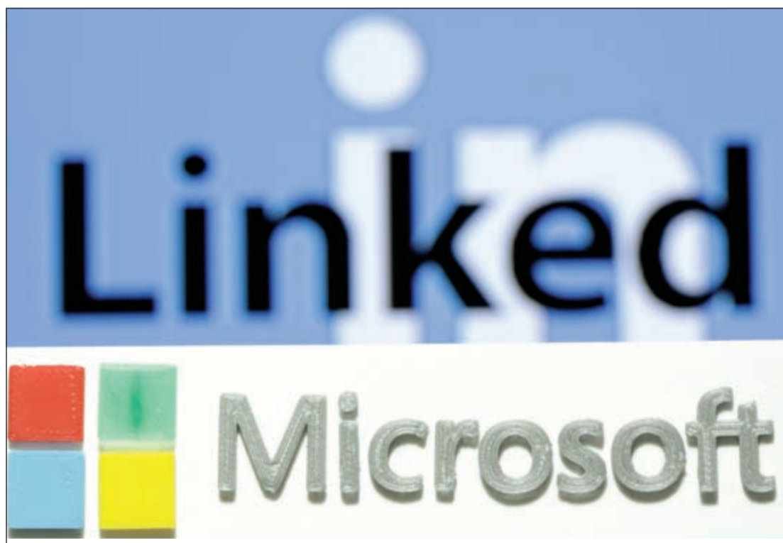
«مايكروسوفت» تعلن استحواذها على موقع التواصل LinkedIn في صفقة تصل قيمتها إلى 26 مليار دولار

هذا الاستحواذ جزءا صغيرا من رؤيتها لمستقبلها، حيث سيكون موقع LinkedIn الذي يسيطر في التطبيقات مثل Outlook، Skype، Office وحتى منصة ويندوز نفسها، حيث ترغب مايكروسوفت في تحويل LinkedIn إلى هوية مركزية لدعم التدفق الذي للمبانيات التي سترتبط المهنيين من خلال اجتماعات مشتركة وأنشطة البريد الإلكتروني، فهو مستقبل استخدام شبكات التواصل القوية وربطها مباشرة بتقنية الذكاء الاصطناعي التي تركز على تطورها مايكروسوفت بشكل كبير خلال الفترة الأخيرة.