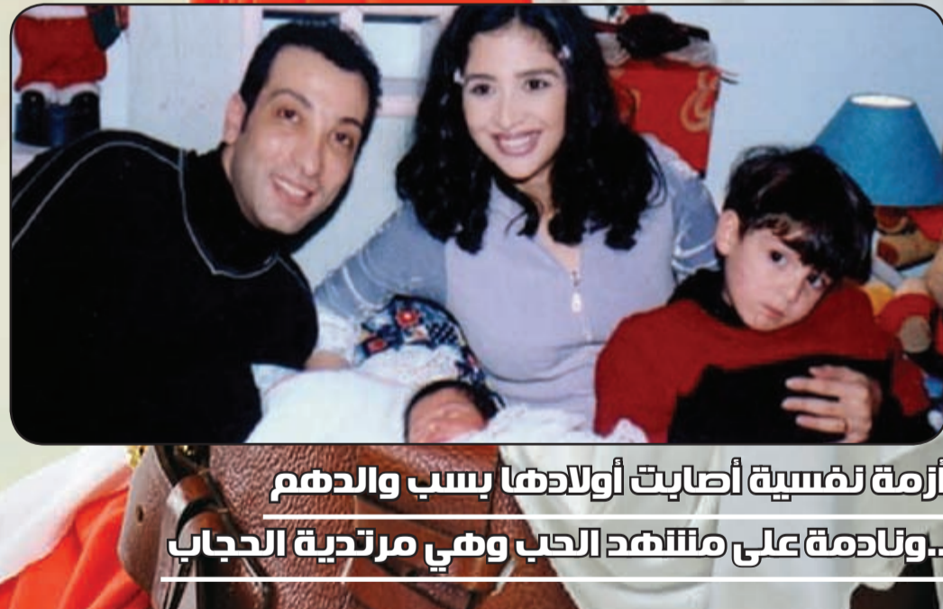
أزمة نفسية أصابت أولادها بسبب والدتهم.. وولادة على مئته الحب وهي مرتدية الحجاب