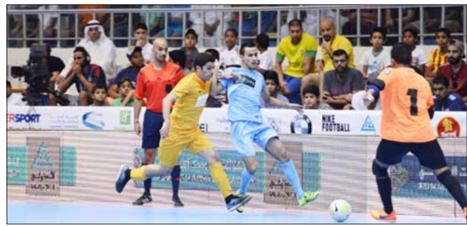
تحد وإثارة في المباريات

وفي المباراة الاولى، تاهل بي ام دبليو الى الادرار الرئيسية بفوز ثان على التوالي جاء على حساب شباب كاظمة بثلاثية مانغروي واحمد الفارس، ليرفع الفائز رصيده لست نقاط، بينما تجدد رصيد كاظمة عند ثلاث، ليصبح في حاجة لتحقيق الفوز على تيماس الذي يشاركه العنيد بهدفين لهدف، بينما تلقى هوليداي ان هزيمة مفاجئة على يد جموعة القروبان بثلاثة اهداف مقابل أربعة.