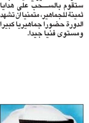
جانب من مواجهة العاقول والقصر الأحمر