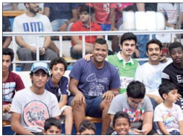
فرحة المشجعين في المدرجات

تم الاستعانة بأربعة حكام معتمدين من اتحاد كرة القدم لإدارة مباريات الدورة ويأتي ذلك من سبب حرص المنظمين على البطولة فنياً. وأضاف أسيري أن اللجنة ستقوم بالسحب على هدايا تيمية للجماهير، متمنياً ان تشهد الدورة حضوراً جماهيرياً كبيراً ومستوى فنياً جيداً.