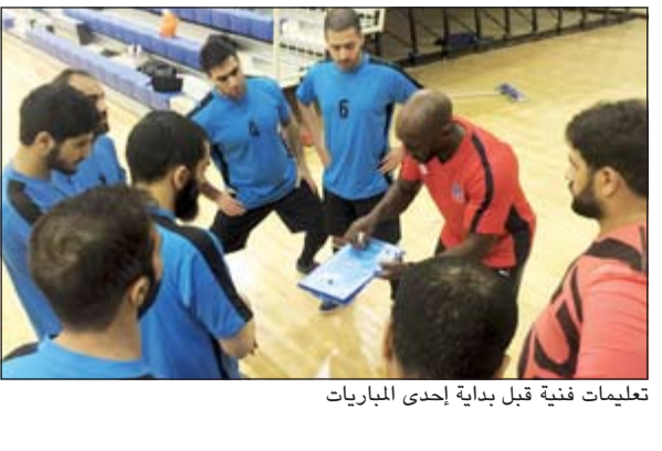
تعليمات فنية قبل بداية إحدى المباريات

حقق فريق الأمن والسيطرة فوزه الاول في افتتاح منافسات بطولة المرحومة الشريحة سلوى الصباح الحادية عشرة لكرة القدم داخل الصالات وذلك على منافسه فريق الوحدات الخاصة بنتيجة 4-1 في اللقاء الذي جمعهما في انطلاقة منافسات البطولة التي شهدت أيضاً فوز مكافحة الشعب على المنشآت النفطية بأربعة أهداف للاشياء، وفي اليوم الثاني لمنافسات البطولة تغلب المتفجرات على الوحدات الخاصة بهدفين نظيفين قبل ان يحقق فريق حماية السفارات الفوز على الحماية الخاصة بهدف دون رد. وتقام منافسات البطولة وفق توجيهات وبرعاية وحضور الفريق سليمان فهد الفهد وكيل وزارة الداخلية واللواء محمود الدوسري، وكيل وزارة الداخلية المساعد لشؤون الأمن الخاص تحت إشراف العقيد خالد صالح ابا الخيل مدير البطولة. من جانبه أشاد رئيس