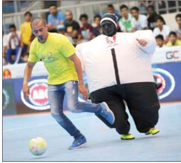
محاولة لتخطي فريق الطبّاخين