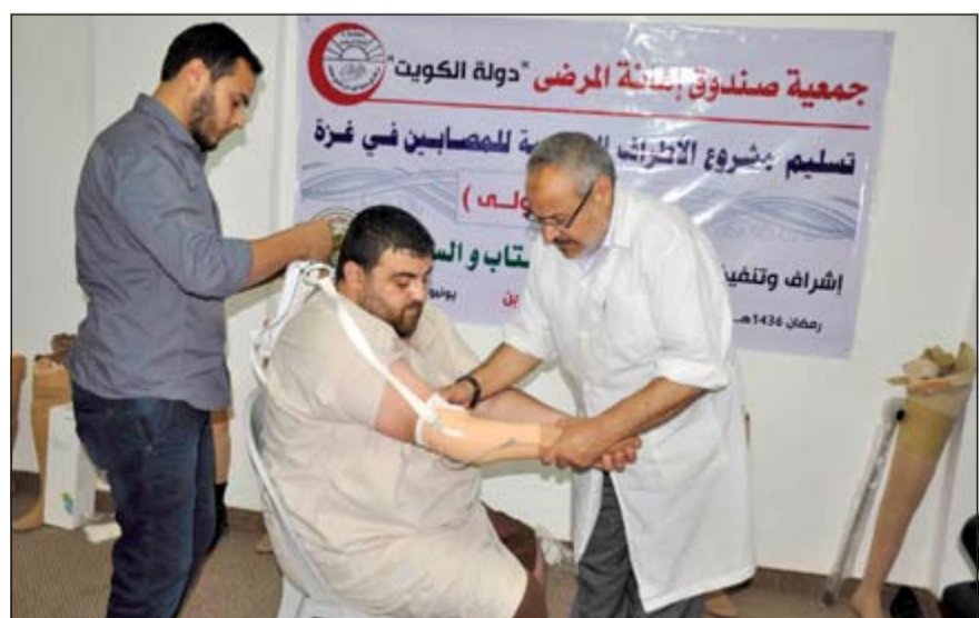
جانبة من الكشف الطبي بأحد المشروعات