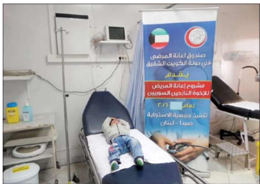
من المشاريع الصحية