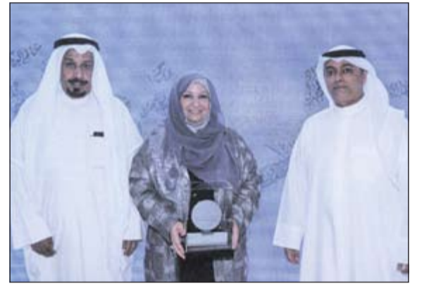
جانبة من التكريم

حضر الحفل وزير الإسكان الأسبق والمدير الأسبق للبنك محمد النوس والسابقين في البنك. وقال المصنف في كلمة ألقاها بهذه المناسبة: إن الحرس على تنظيم هذا الاحتفال إنما يأتي تعبيراً عن الوفاء والامتنان لهذه الكوكبة من الموظفين السابقين في البنك، الذين أخلصوا العمل وأعطوا من وقتهم وجهدهم الكثير لهذا الصرح الوطني الكبير على مدى سنوات، كانوا فيها معنا لا ينضب بالخبرات، ونهراً لا يجف عطاؤه لكل العاملين، ولم فلم يخلوا بنصيحة، ولم يذخروا جهداً، ووضعوا أسس