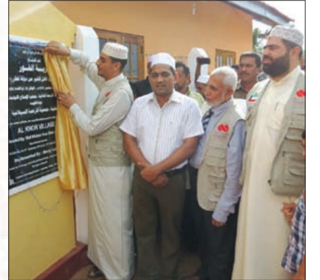
افتتاح مشروع القارة العنيدة

فانصت إليها فقصت له قصتها وأخبرته بأنها كانت تعمل في إحدى دول الخليج وأسلمت وحسن إسلامها وأصبحت تدعو الناس إلى الإسلام وأنشروا قلب الرجل وفرح، وسألها ما ينقصكم فأخبرته بأن هناك بعض الأسر المسلمة حديثاً تحتاج إلى بعض البيوت فقعد العزم على بناء 56 بيتاً للفقراء بشرط أن يكون أربعون منها لتلك الأسر التي أسلمت و16 بيتاً توزع على حسب النظام المتبع للرحمة العالمية، هذا المتبرع أكد أن تلك الرحلة كانت من أفضل الرحلات التي أثرت في حياته، فهذا الرجل أطلق في البداية عشرين بيتاً وذلك حينما سمع لكن ما أن رأى حاجة الناس إلى تلك البيوت ودفقة الرحمة العالمية وتميزها واحترافيتها الا وأطلق عشرة بيوت أخرى تسم قرية كاملة تتكون من 56 بيتاً، بالفعل من رأى ليس كمن سمع.