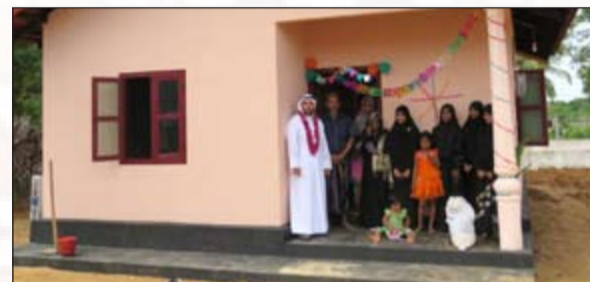
أحد المشاريع في سريلانكا