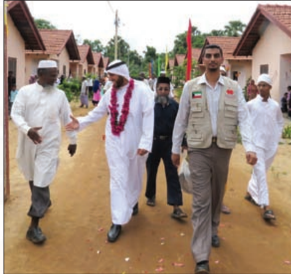
في زيارة لإحدى القرى

فكيف يسوغ لأحد من المسلمين، وقد أعزّه الله ببعثة خاتم النبيين، صلى وسلم عليه رب العالمين: أن يبتغي العزة من أعدائه الكافرين؟ فكيف يسوغ له ذلك وهو يقرأ هذه الآية التي نزل بها الروح الأمين، على قلب النبي صلى الله عليه وسلم ليكون من المنذرين: (الذين يتخذون الكافرين أولياء من دون المؤمنين أيتنون عندهم العزة فإن العزة لله جميعاً).