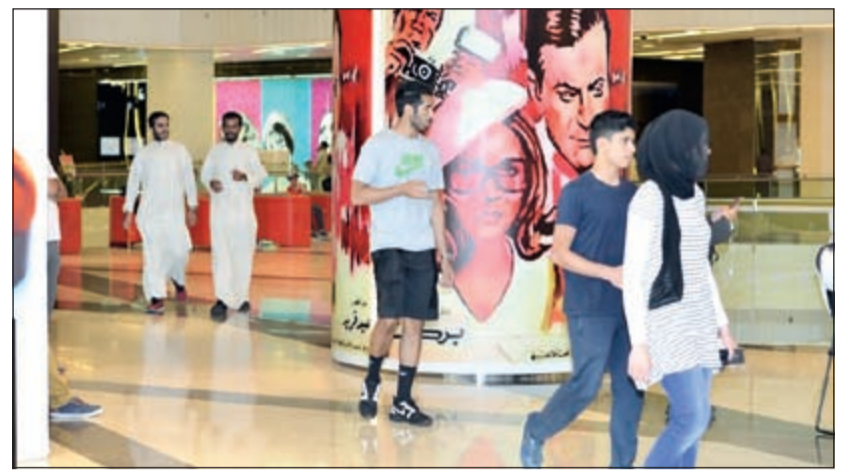
جانب من حملة «خطوات»

تحقق حملة خطوات التي ينظمها بنك بويان بالتعاون مع مجموعة P5M الشدايبية وبرج الحمرا نجاحاً كبيراً من خلال ارتفاع نسبة المشاركة في الحملة التي ينظمها للعام الثالث على التوالي وتهدف إلى جمع أكبر مبلغ للتبرع به لعمليات إعادة النظر للاطفال في أفريقيا. وتهدف الحملة إلى تشجيع رياضة المشي خلال الشهر الفضيل، على أن يقوم البنك بالتبرع بدينار واحد مقابل كل خمس دورات مشي يقوم بها أي شخص في برج الحمرا طوال أيام الأسبوع قبل الإفطار وتحديدًا من الساعة الرابعة إلى الساعة السادسة بعد الظهر. ويهدف البنك حملة «خطوات» إلى الحفاظ على صحة المتطوع من خلال ممارسة رياضة المشي إلى جانب التركيز على واحدة من أهم قيم البنك وهي التبرع لصالح مختلف فئات المجتمع حيث سيتم تخصيص ربع العام الحالي لعمليات إعادة البصر للأطفال في إحدى الدول الأفريقية وهي العمليات التي سيقوم بإجرائها مجموعة من الأطباء الكويتيين. ويمكن للأشخاص أن يشارك في حملة «خطوات» من خلال ممارسة الآباء والأمهات رياضة المشي حيث خصص البنك مكافآت للأطفال يمكنهم البقاء فيه والإستمتاع بالألعاب والبرامج الترفيهية تحت إشراف متخصصين. كما تعقد جلسة حوار أو ورش عمل يقدم خلالها المتخصصون نصائح تتعلق بممارستنا اليومية وسلوكياتنا الصحية والعمل وغيرها. وفي جولة بين المشاركين في حملة «خطوات» في برج الحمرا كانت لنا بعض اللقاءات حيث كان