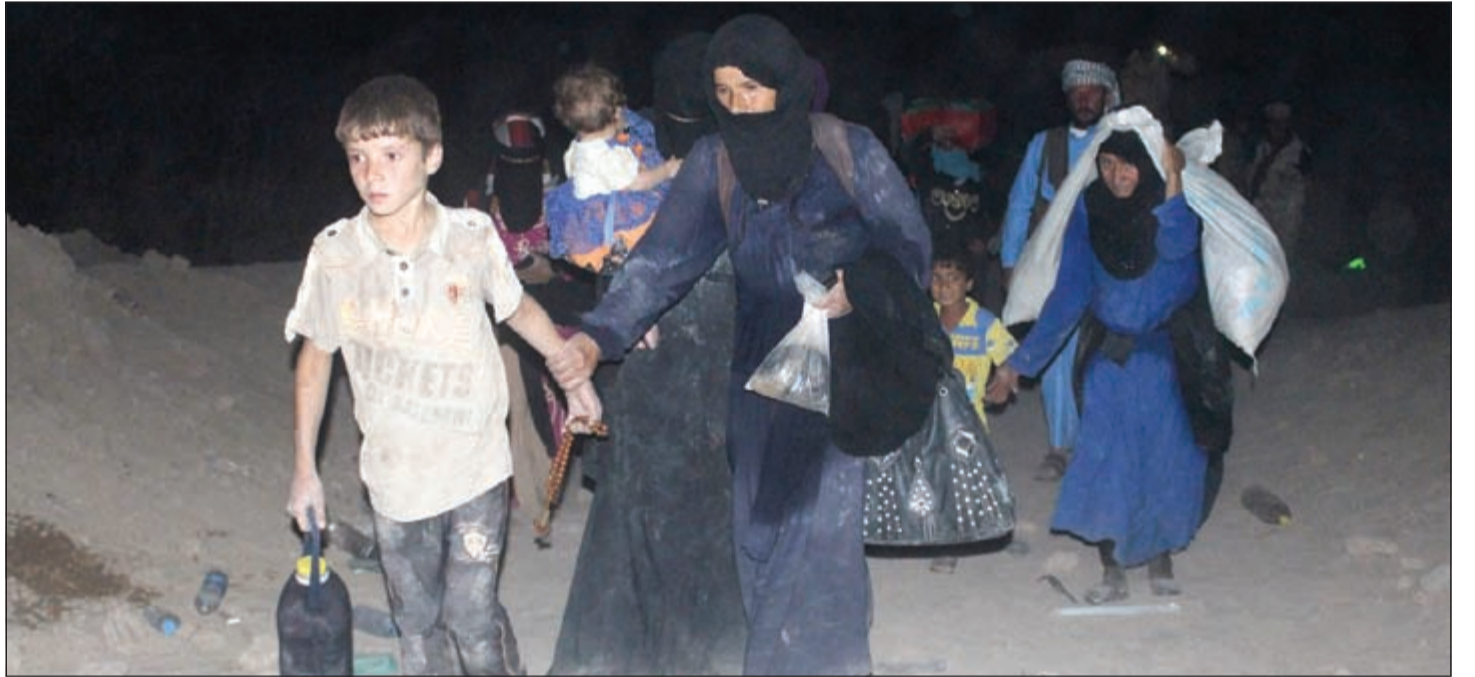
عائلة عراقية تارحة من المعارك في الفلوجة عبر الممر الآمن الذي اعلن عنه مؤخرا

عائلة عراقية تارحة من المعارك في الفلوجة عبر الممر الآمن الذي اعلن عنه مؤخرا