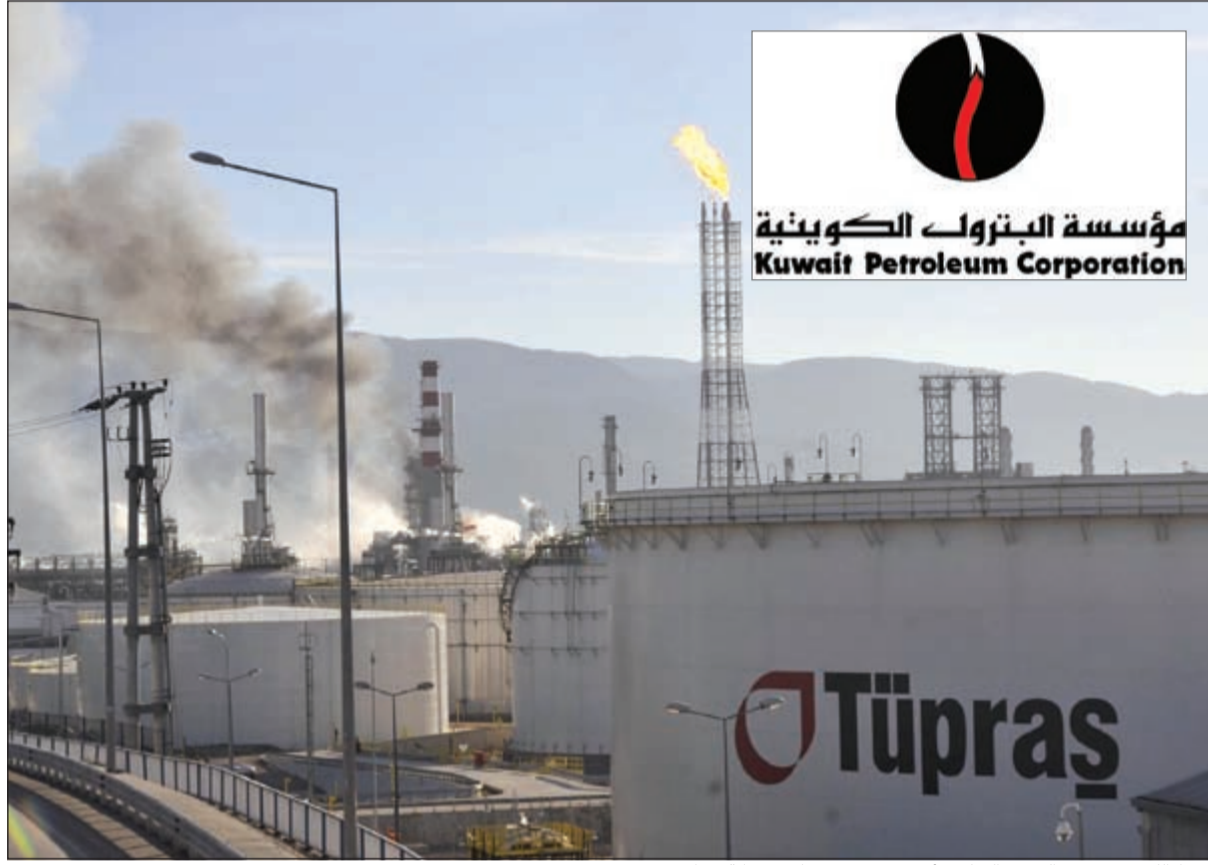
النفط الكويتي يدخل السوق التركي لأول مرة عبر مصافي شركة تبراس

وقال ان مؤسسة البترول تمكنت من الدخول مؤخرا الى سوق حوض البحر الابيض المتوسط وذلك عبر تصريف 70