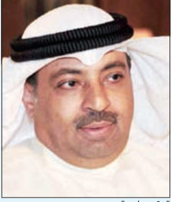
العقيد وليد الدرعي

تستضيف «الأبناء» غدا الإثنين مدير عام الإدارة العامة لمكافحة المخدرات بالإتابة العقيد وليد الدرعي في ديوانية «الأبناء» للرد على الاسئلة والاستفسارات بكل ما يتعلق بالمخدرات والخمور وبلاتغات الإدمان. الدرعي سوف يرد على استفساراتكم من الساعة 7,30 - 9,30 مساءً، ويمكنكم التواصل معه عبر هاتف «الأبناء» 22272888.