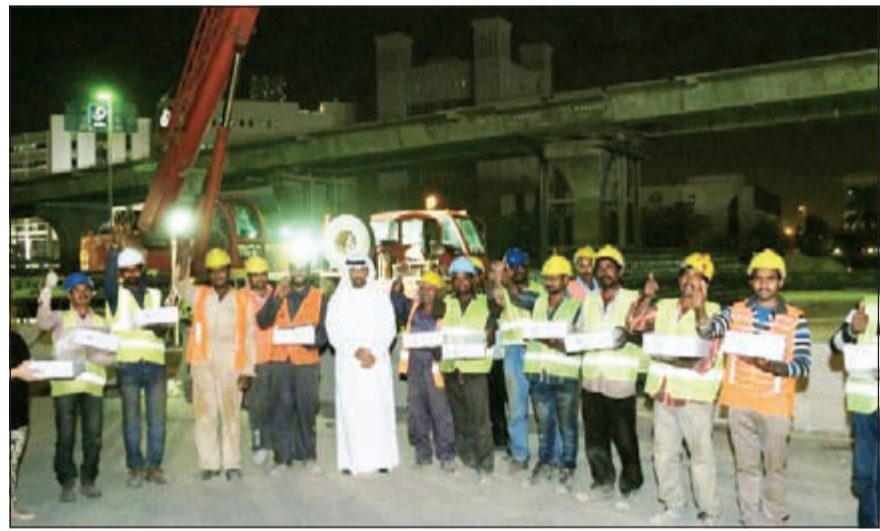
جانب من حملة «سحوركم علينا»

ضمن برنامج الرضائي الحافل بالأنشطة الاجتماعية والإنسانية الخيرية، قام البنك التجاري الكويتي بإطلاق حملته الجديدة والمبتكرة التي حملت عنوان «سحوركم علينا» لتوزيع وجبات السحور على عمال التنظيف والبناء الموجودين في الشوارع خلال شهر رمضان المبارك.