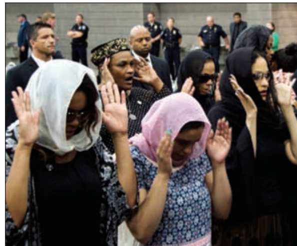
.. وصلاة الجنازة على روحه

لوفيفل - د.ب.؛ شارك آلاف المشيعين في تكريم أسطورة الملاكمة محمد علي كاي في طقوس جنازية إسلامية عشية مراسم تأبينه التي ستجري على مدار يوم كامل في مدينة لوفيفل بولاية كنتاكي، مستقط رأس الراحل بطل العالم للوزن الثقيل