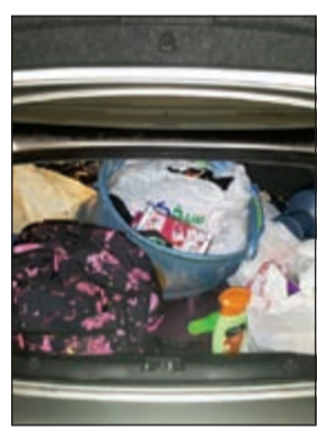
حصيلة التسول في مركبة المتسولة