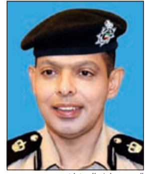
العميد عادل الحشاش

خريجوا الثانوية يمكنهم التقدم للالتحاق بدورات ضباط الصف (رقيباً أوائل) ليحصلوا على دبلوم في تخصصات مختلفة