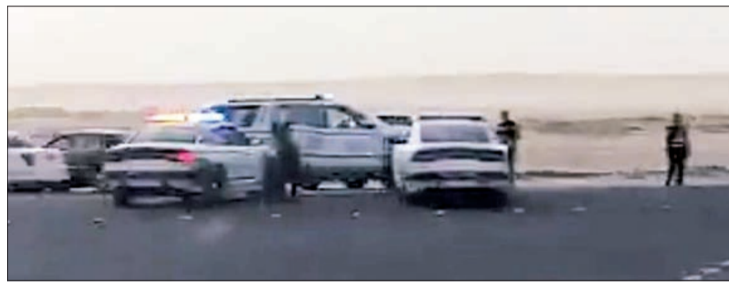
الركبات على طريق الأرتال

حجز المرور. وقال مصدر أمني أن دوريات الأمن العام والنجدة تواجد رجالها على طريق الأرتال قبل بزوغ الشمس حتى لا يستغل المكان للاستهتار والرعونة والمجاهرة بالإفطار من قبل العديد من المتجمهرين من الشباب. وأضاف المصدر أن رجال الأمن قاموا بإحالة مركبتين للحجز وتحرير 14 مخالفة مرورية وضبط مركبات مخالفة لقانون المرور. وأفاد المصدر بأن الحملات على طريق الأرتال مستمرة في الأيام القادمة حتى ينتهي التجمع الشبلي الذي يتجه إلى موقع طريق الأرتال الواقع على خط السالمي.