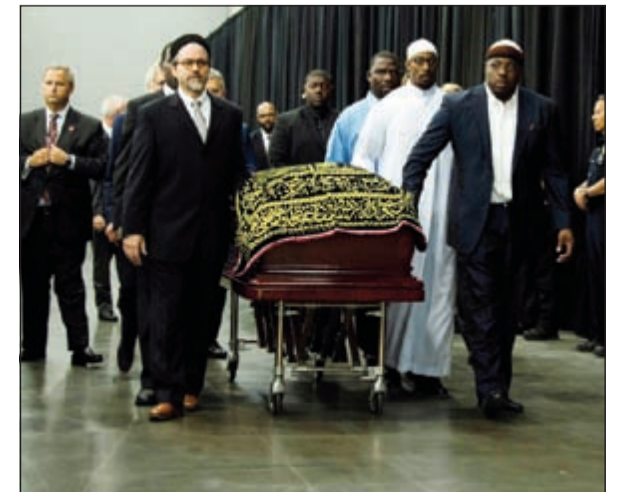
تعش يحمل جثمان كلاي