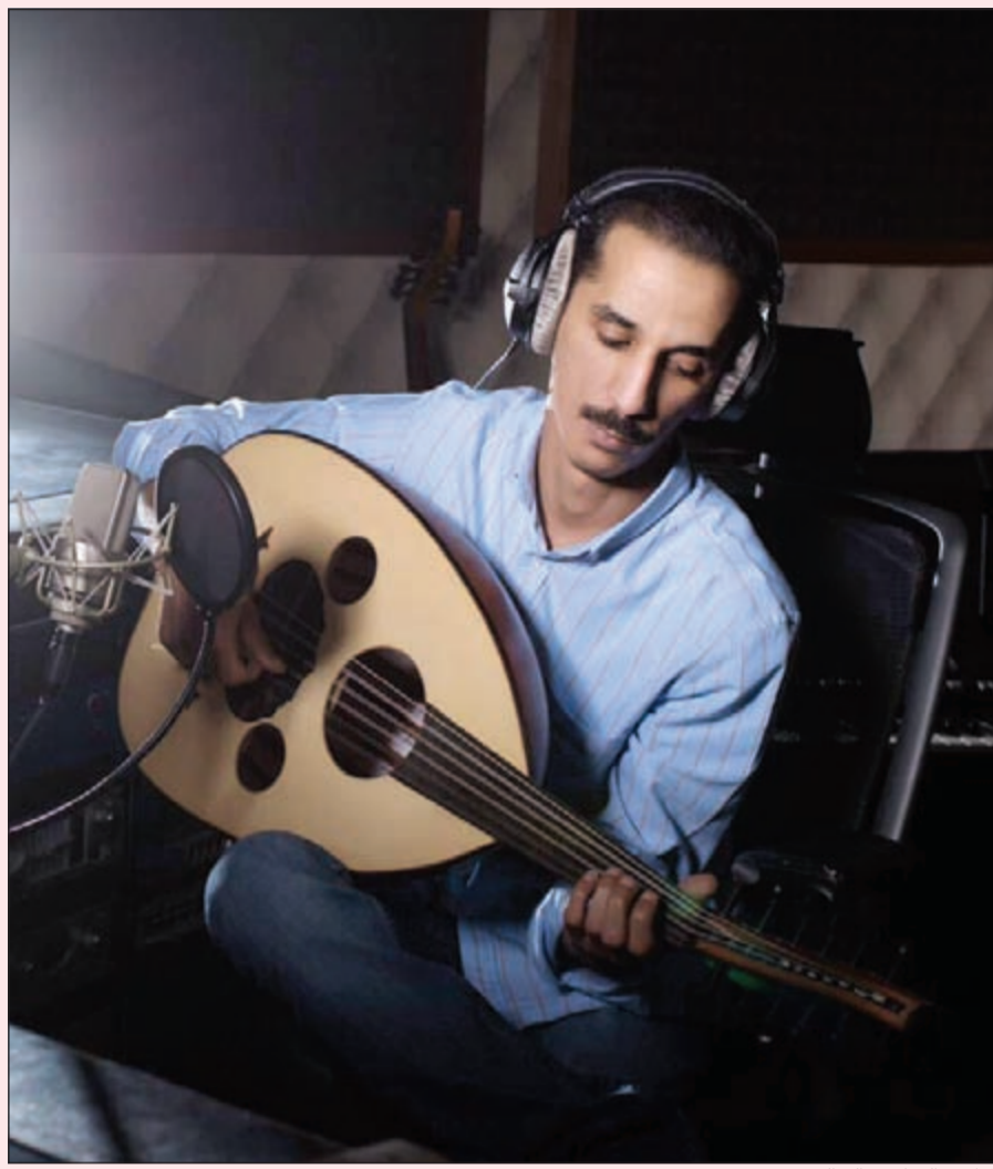
المطرب الشاب خالد الرويشد

● «تو الناس» على هذا الخطوة، واحتاج أن ابني لنفسي أولاً جمهوراً، وعندما أشعر أن لدي ما أقدمه على المسرح فعندها سأقدم على