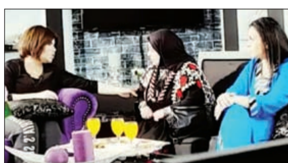
مشهد من مسلسل «الوجه المستعار»

عدد كبير من الممثلات يشاركن في مسلسل «الوجه المستعار»، وهذا شيء جميل، لكن ما ليس جميل ان خدود وشفايف هؤلاء الممثلات حجمها غير طبيعي إلى درجة أثرت على حواراتهن لأن كلامهن ليس واضحاً، والمشاهد يحتاج لترجم حتى يفهم ما يقولونه .. ارحمونا!