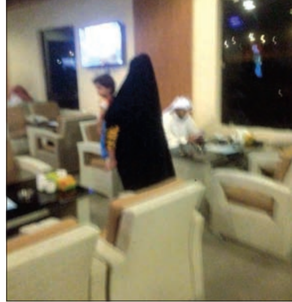
وافدة ضبطت خلال تسولها في مطعم راق