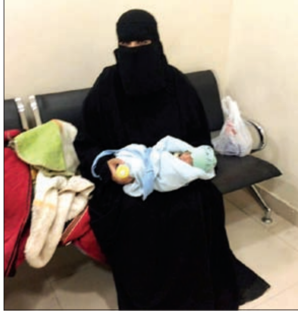
... الاستعانة بالأطفال