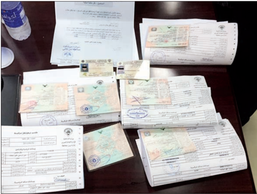
معاملات تحويل المركبات التي ضبطت بحوزة البنغالي

المركبات، كما عثر بحوزة البنغالي على مواد مخدرة، وبحسب مصدر امني فإن إحدى الدوريات وخلال جولة لها حول أحد المساجد اشتبهت في الوافد ولدى طلب هويته حاول الهرب لتتم مطاردته وضبطه وكانت المفاجأة انه يحتفظ بالمعاملات داخل حقيبة حاول التخلص منها، كما ضبط فيها على أدوات تعاط.