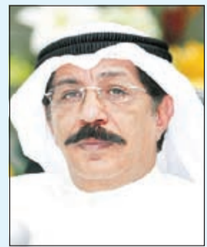
اللواء عبد الحميد العوضي

المعلومات والتحريات وعلى الفور تحركت الفرقة وداهمت الشقة وهي عبارة عن غرفة في ملحق بعمارة بسلاوي وعثر على مصاد مخدرات ومؤثرات عقلية يقوم الوافد بتوزيعها والمتاجر بها و3 وصلات حشيش معدة للبيع وكمية من الشبو. وخلال التحقيق اعترف لهم ودل رجال المباحث على مصدر هذه المخدرات التي يتحصل عليها من وافد عربي يسكن في الفروانية، وعلى الفور توجهت الفرقة الى المكان وتم ضبط الوافد العربي وعثر على كمية من المخدرات والمؤثرات العقلية وأدوات التعاطي وميزان حساس للأوزان حيث اعترف بأنه يدير العمل لمصلحة وافد باكستاني سجين بالمركزي ويأتمر بأمره ويتلقى منه أوامر البيع.