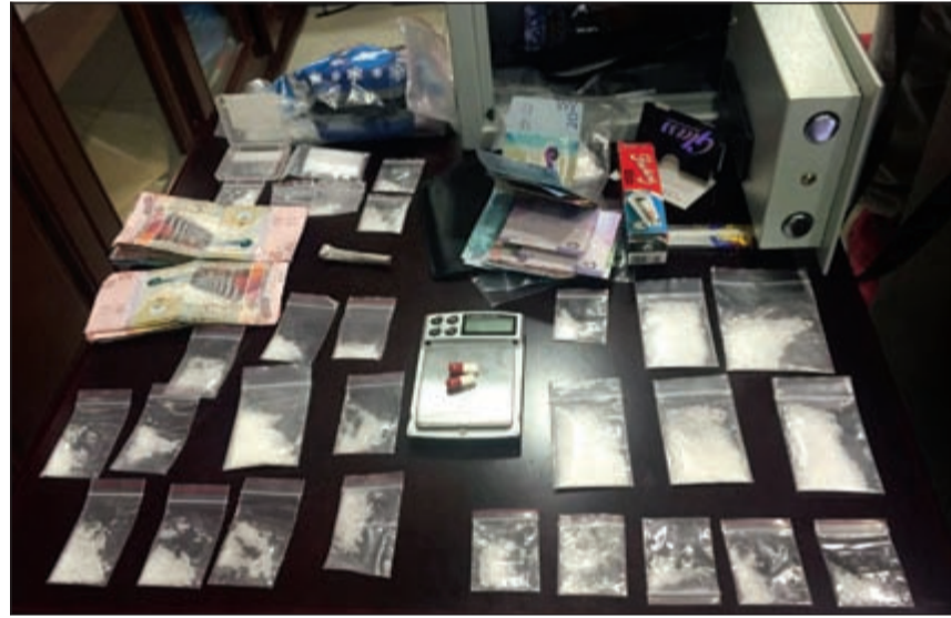
المضبوطات من المواد المخدرة