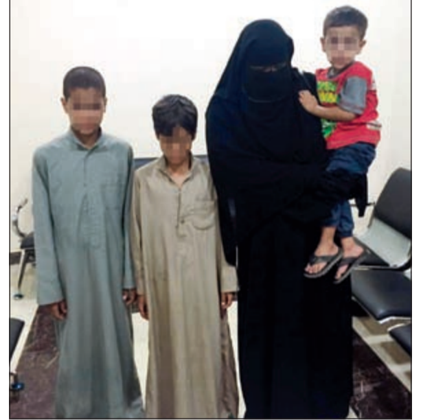
الوافدة العربية وابنائها الثلاثة ضبطوا بالتسول