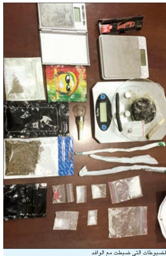
المضبوطات التي ضبطت مع الوافد