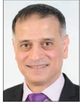
إعداد: د. طارق البكري