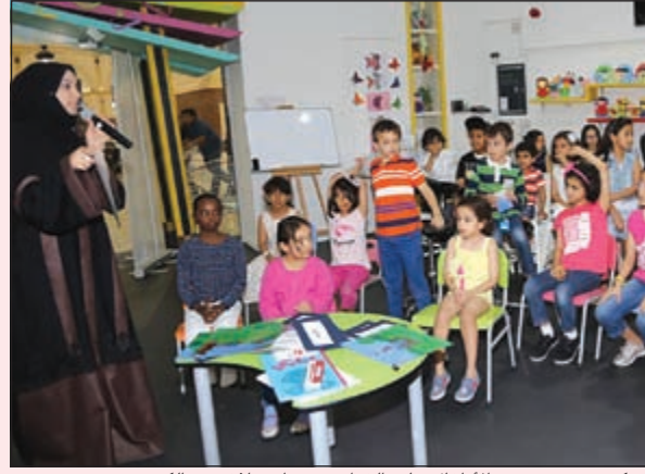
«مكتبتني».. يشجع الأطفال على القراءة وتوطد علاقتهم بالكتب