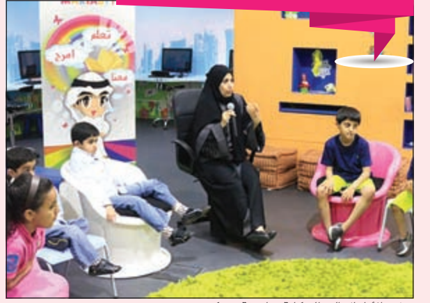
جذب الأطفال إلى الحكاية بطريقة مبتكرة