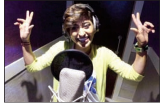
شجون أثناء التسجيل

يواصل نجوم مسرحية «بيت الحلاو» استعدادهم المبكر لعرض المسرحية على مسرح النادي العربي الرياضي وذلك نظرا لحجم الاستعراض والموسيقى والتقنيات الجديدة التي يحتوي عليها العرض المسرحي، فقد شارك كل الفنانين في تركيب أصواتهم بعدما تم الانتهاء من التوزيع الموسيقي الذي تم بين الكويت وتركيا تحت إشراف الموزع الموسيقي حسن الرئيسي والفنان عبد المحسن العمر والذي قام بتدريب كم كبير من الأطفال المشاركين في المسرحية، كذلك تصميم الديكور والسنغرافيا ليتناسب مع هذا الحدث المسرحي حيث تم العمل فيهما قبل شهر رمضان بفترة طويلة من أجل إنجازهما بشكل ينسجم مع الفكرة ويتوافق مع هذا الكم من التكنولوجيا والموسيقى والاستعراضات وهذا الحجم الكبير لخشبة المسرح التي تعرض عليها المسرحية للجمهور.