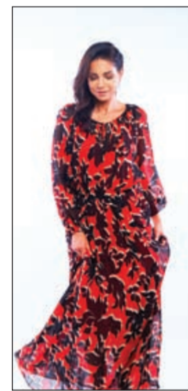
فستان جيراند داريل