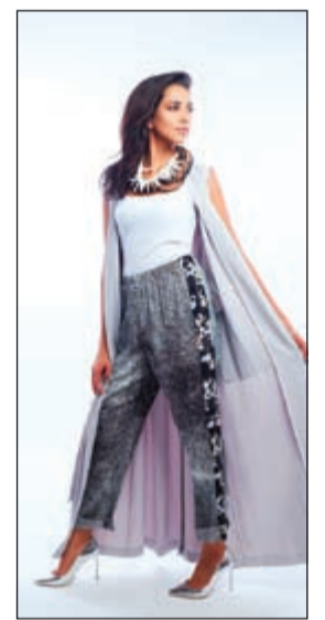
بنطلون كنزو وجاكيت DKNY وحذاء جيمي شو وعقد ماكس مارا

نحرص فيه على ارتداء الملابس الواسعة، وتضم هذه المجموعة العديد من الفساتين التي يمكن مزجها مع قطع أخرى لصنع طبقات (layering).