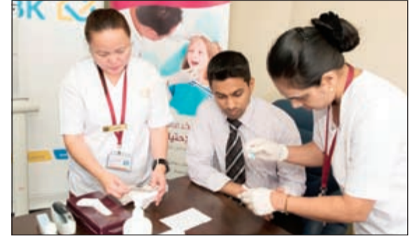
موظفو البنك أثناء إجراء الفحوصات