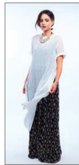
أوفرول ماريليا مع بلوزة طويلة DKNY والعقد ماكس اند كو