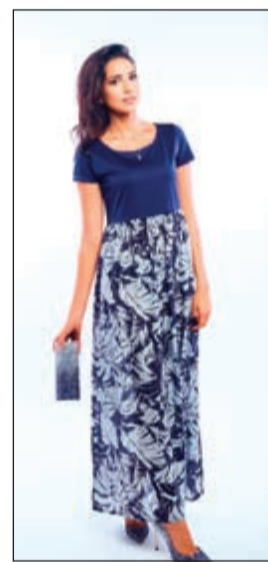
فستان ماكس مارا وحقبة يد صغيرة وحذاء جيمي شو