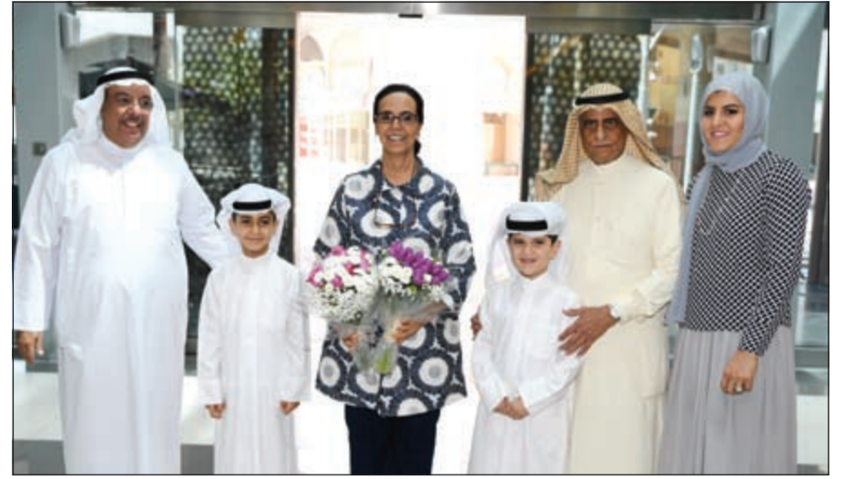
ترحيب بالشيخة أمثال الأحمد في مجمع البروميناد

تحت عنوان «قصتنا: هويتنا الثقافية» واحتفالاً بافتتاحه وإعلاناً لبدء أنشطته