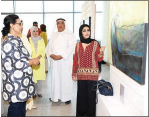
الشيخة أمثال الأحمد تستمع لشرح من إحدى الفنانات المشاركات

وستتيح ورش العمل التي يستضيفها المركز - الذي يتسع لـ 400 شخص دفعة واحدة - مساحات خاصة لإقامة أنشطة مستقلة أو تعاونية بالتزامن مع استضافة المعارض، حيث صممت وحدات استضافة الورش بشكل ذكي للأنشطة التفاعلية، وتتسع كل واحدة منها لما يصل إلى 12 شخصاً. ويقع «البروميناد» على طريق الدائري الثالث مقابل القادسية.