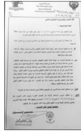
صورة من كتاب ديوان الخدمة المدنية

وعودة إلى هذه القضية التي تكشفها «الأنباء»، فقد صدر قرار من مجلس الخدمة المدنية في عام 2012 واتبع بموجبه خطاب عام