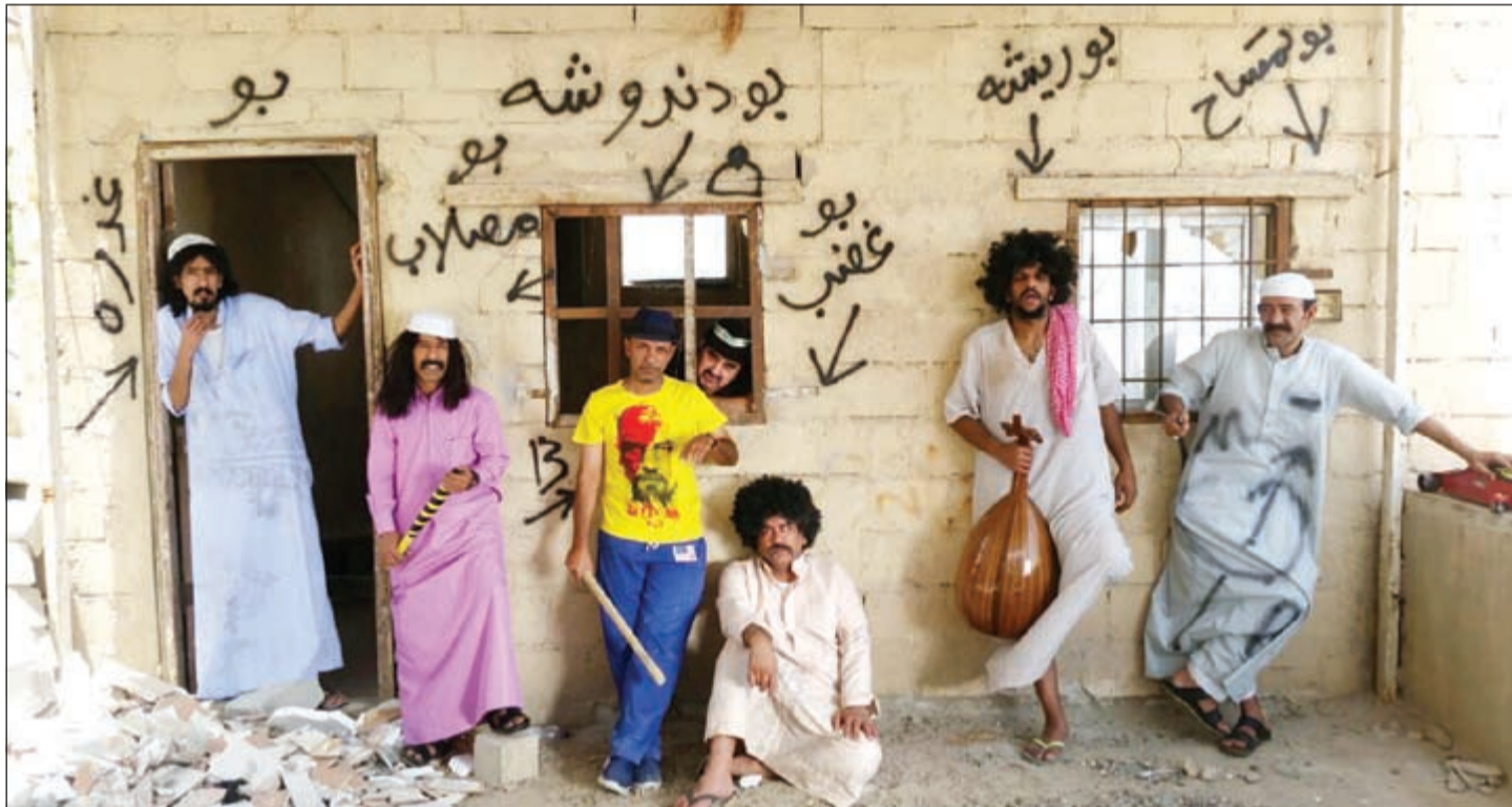
نجوم «سناب آت»

وفيما يخص فيديو كليب أغنيته «ما بلاش» من البومته الأخير «عمره ما يغيب»، فقد قرر حماقي، حسب موقع «نواوم»، أن يطرحه خلال عيد الفطر بعد انتهاء شهر رمضان المبارك أي في يوليو المقبل.