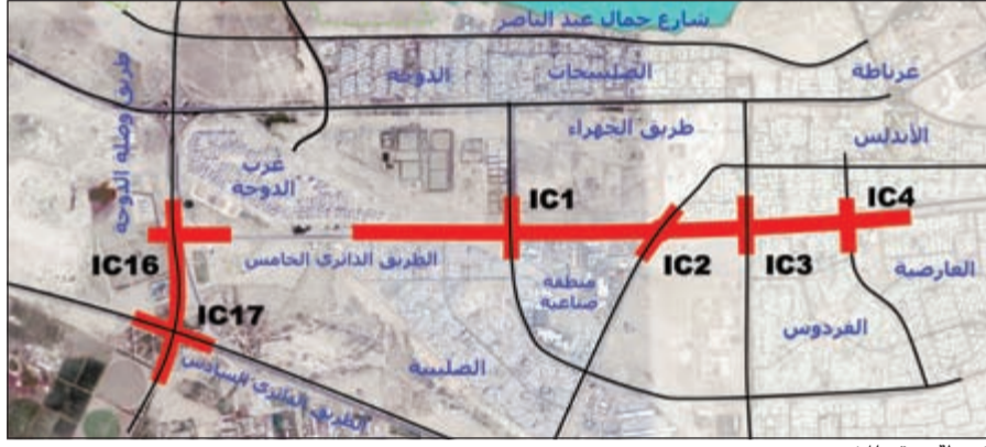
خريطة موقع المشروع