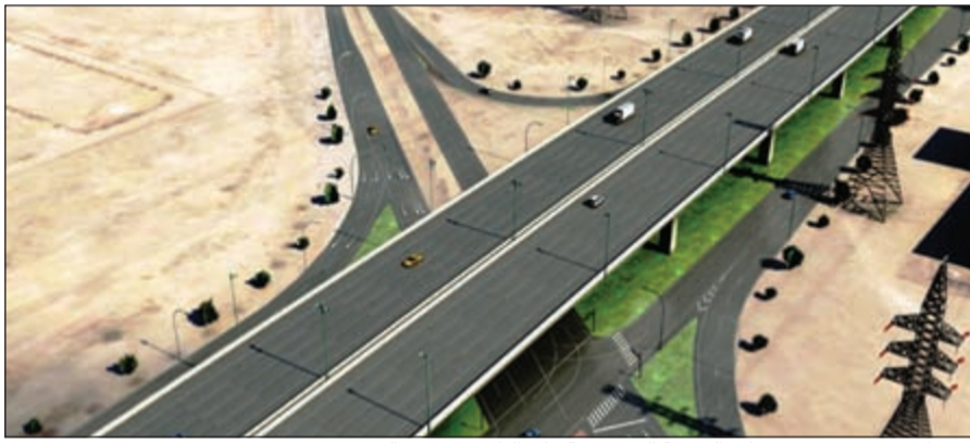
تنفيذ المشروع سيسمح بزيادة السرعة التصميمية على الطريق من 80 إلى 120

● نعم حصلت الوزارة على جميع التصاريح والموافقات من الجهات ذات العلاقة بالمشروع وهي المرور والبلدية والكهرباء وجهات أخرى.