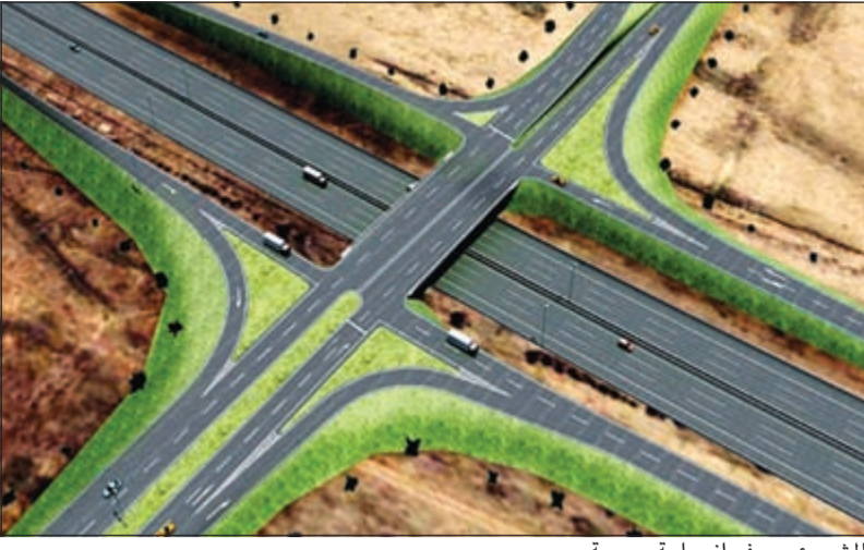
المشروع سيوفر انسيابية مرورية