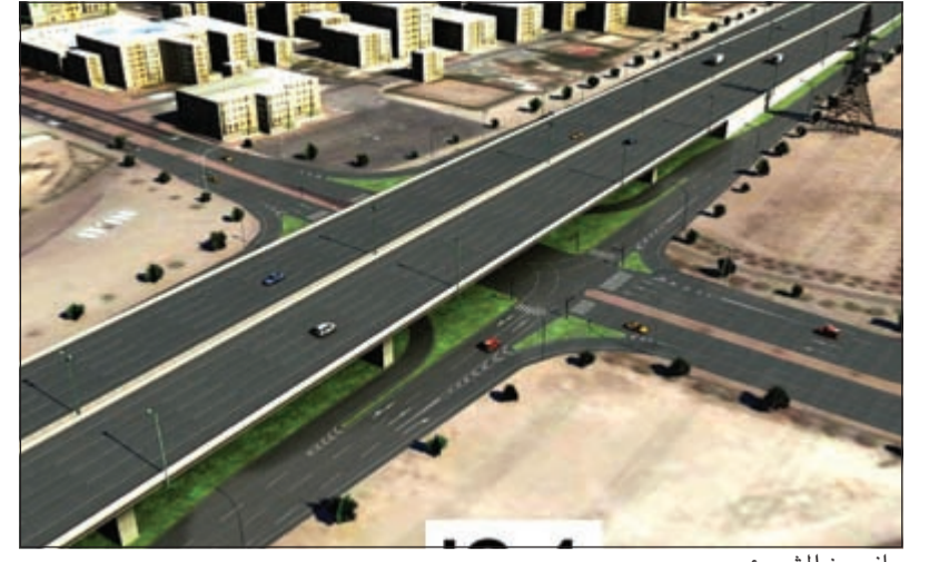
جانب من المشروع

أكد أن المشروع يهدف إلى رفع مستوى الخدمة للطريق القائم