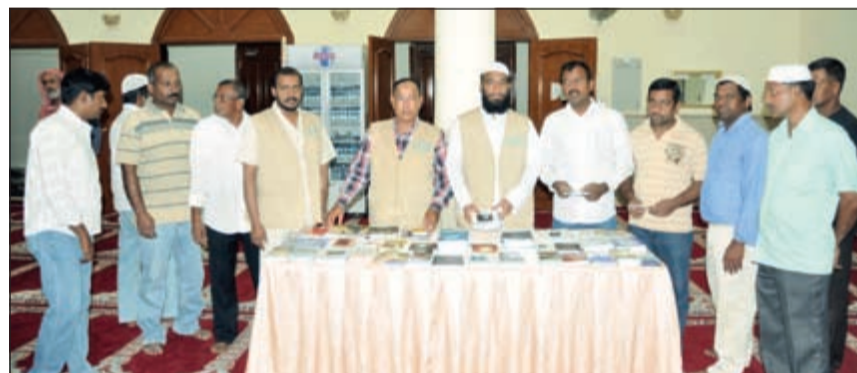
توزيع وسائل دعوية من أنشطة دار الميلم للتعريف بالإسلام

الدعاة العاملين بالدار 10 دعاة بشتى اللغات. وحول أهمية الأنشطة الدعوية التي تقدمها الدار وباقي فروع لجنة التعريف بالإسلام، أشار النبهان إلى