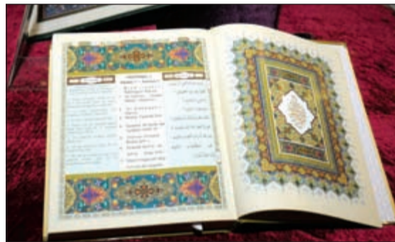
طبعا مميزة تضمنتها المعرض