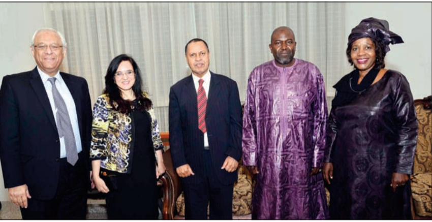
سفرء مصر والصومال والسنغال يهنئون

تطوراً ملحوظاً في السنوات الثلاثة الاخيرة تم خلالها تحقيق الكثير من النتائج الايجابية على مستوى العلاقات الاقتصادية والتجارية حيث ارتفع حجم التبادل التجاري بين البلدين إلى 406 ملايين دولار، أي بزيادة تقدر بنحو 10 اضعاف خلال السنوات الثلاثة الاخيرة. وأضاف سولوماتين في تصريح له على هامش الحفل، ان زيارة صاحب السمو الأمير الأخيرة إلى موسكو كانت زيارة تاريخية، مشيراً إلى اتفاقيات عسكرية المهمة في المنطقة، مبيّناً ان الدور الروسي أصبح متنامياً وواعداً بالتعاون المتخمر بين المسؤولين في البلدين بهذا الخصوص. ولفت بخصوص التعاون الروسي الكويتي بمجال النفط، إلى وجود شركات روسية بدأت تتعاون مع الشركات الكويتية من خلال بيع التكنولوجيات الروسية الحديثة في إنتاج النفط ومكافحة التلوث الناتج عن هذه العمليات، وتم البدء فعلياً بتنفيذ هذا المجال من التعاون، مشيراً إلى تعاون في مجال الغاز أيضاً، وهناك استعداد من قبل روسيا، خاصة في صناعة البلاستيك بواسطة الغاز. وأوضح ان السفارة اصدرت خلال العام الماضي نحو 3500 تأشيرة.