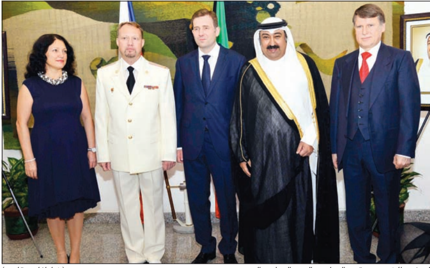
السفير الخبزيي يقدم التهانئ بالعيد الوطني الروسي (شانافاس قاسم)

لظروفهم. يتذكر ان الكويت قدمت مساعدات مالية لإغاثة النازحين في العراق بقيمة تزيد على 200 مليون دولار، كما وزع الهلال الأحمر الكويتي العام الماضي ما يقارب 40 ألف سلة غذائية على العائلات النازحة في مدن إقليم كردستان العراق.