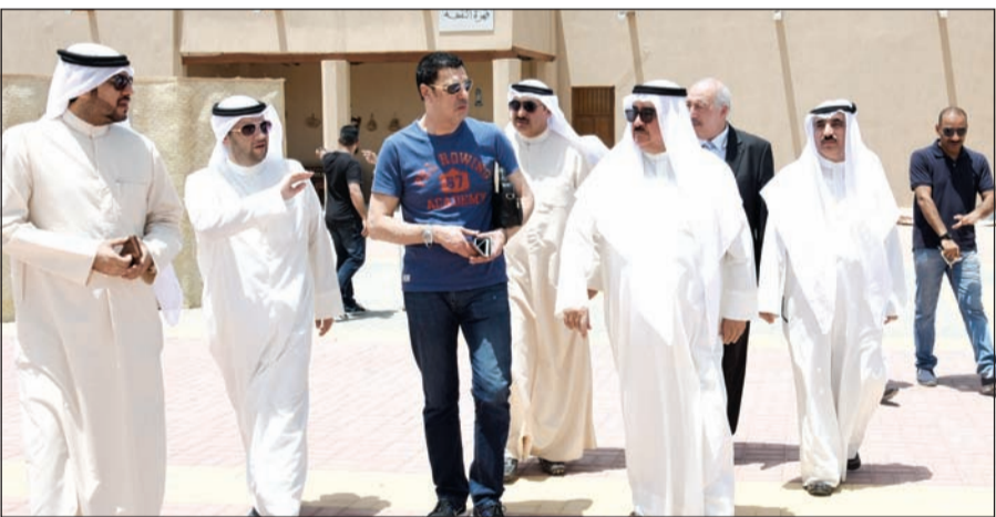
الفريق م. ثابت المهنا ومسؤولو الاعلام في جولة بقصر نايف مقر مدفع رمضان

كل ما هو قديم وتراثي لاسيما اذا كان مرتبطاً بحياة الشعوب وعاداتها المرتبطة بشهر كريم يجله المسلمون في كافة انحاء المعمورة، مشيراً أن أجهزة الرصد الفلكية والحداثة لم تلغ تلك العادات التي باتت جزءاً من يوميات رمضان. وشكر المحافظ بيت التمويل الكويتي وبند الكويت الوطني وكافة الجهات الراعية والمشاركة في تعزيز نجاحات برنامج مدفع الإفطار. من جانبه، كشف وكيل وزارة الاعلام المساعد لشؤون التلفزيون يوسف مصطفى أن برنامج مدفع الإفطار لشهر رمضان القادم سيكون مختلفاً شكلاً ومضموناً، معرباً عن ارتياحه للاستعدادات المبكرة التي قامت بها الوزارة لكافة الأنشطة والفعاليات المصاحبة للبرنامج، داعياً الجمهور إلى المسارعة للحضور إلى مدفع الإفطار خلال أيام الشهر الفضيل حيث خصصت وزارة الاعلام بالتعاون مع الجهات الراعية مجموعة من الجوائز المتنوعة التي ستسعد الجمهور، شاكرًا كافة الرعاية لاسيما بنك الكويت الوطني على مبادراتهم التي تحمّلهم مسؤوليتهم الاجتماعية في اخراج عملنا بالشكل الذي يتناسب وروحانيات هذا الشهر المبارك.