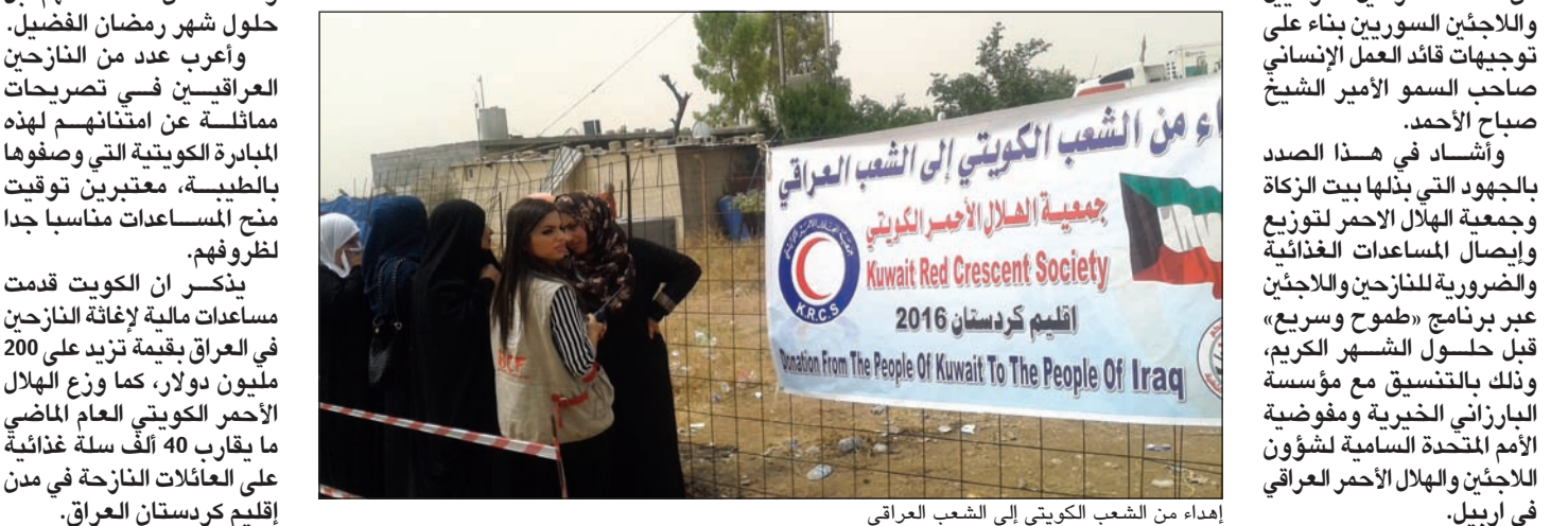
إهداء من الشعب الكويتي إلى الشعب العراقي

أربيل - كونا: قال القنصل العام للكويت في أربيل د.عمر الكندري ان الكويت نجحت في فترة قصيرة في توزيع أكثر من 12 ألف سلة غذائية على أسر نازحين سوريين وعراقيين في إقليم كردستان بمناسبة قرب حلول شهر رمضان الكريم. وأكد الكندري لـ «كونا» حرص الكويت على الاستمرار في حملتها الإنسانية للتخفيف من معاناة النازحين العراقيين واللاجئين السوريين بناء على توجيهات قائد العمل الإنساني صاحب السمو الأمير الشيخ صباح الأحمد. وأشاد في هذا الصدد بالجهود التي يبذلها بيت الزكاة وجمعية الهلال الأحمر لتوزيع وإيصال المساعدات الغذائية والضرورية للنازحين واللاجئين عبر برنامج «طوح وسريع»، قبل حلول الشهر الكريم، وذلك بالتنسيق مع مؤسسة البارزاني الخيرية ومفوضية الأمم المتحدة السامية لشؤون اللاجئين والهلال الأحمر العراقي في أربيل.