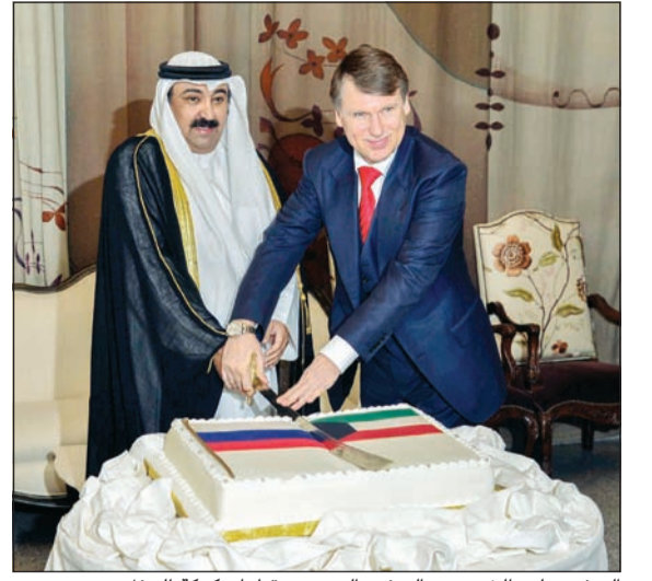
السفير وليد الخبزيي والسفير الروسي يقطعان كعكة الحفل