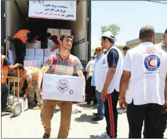
جانب من توزيع المساعدات