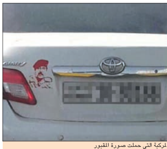
المركبة التي حملت صورة المقبور