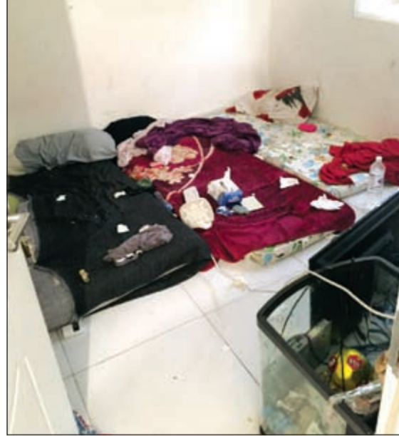
هنا كان يجلس أشقاء الطفلة