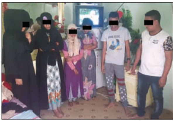
الموقوفون في الوكر