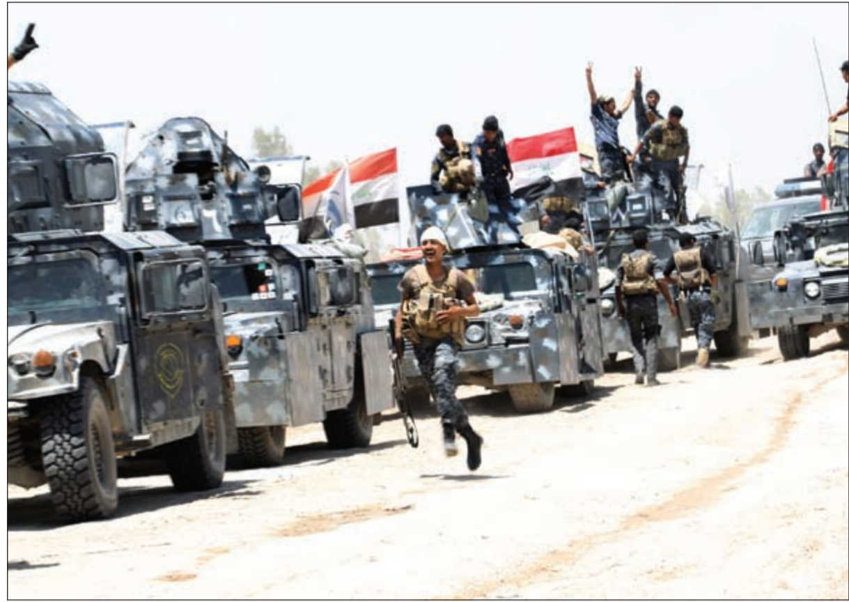
جنود من القوات الموالية للجيش العراقي فوق مدرعاتهم خلال معركة تحرير الفلوجة أمس (رويترز)

من جانبها، قالت المتحدثة باسم المفوضية أريان روميرو إن الشهادات جاءت من نازحين تحدثوا إلى موظفي المفوضية الميدانيين.