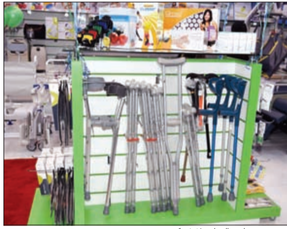
من معروضات «السايير لايف كير»