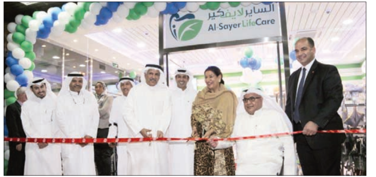
قص شريط افتتاح فرع «السايير لايف كير»

لتصبح أكثر قربا من ذوي الاحتياجات الخاصة