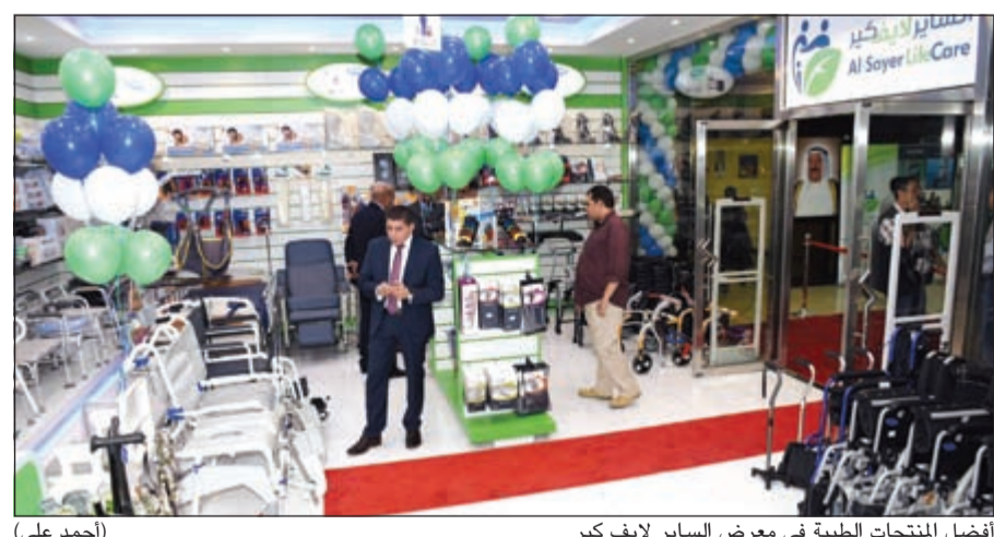
أفضل المنتجات الطبية في معرض السايير لايف كير (احمد علي)