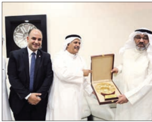
درع تكريمية تقديرا للجهود المبذولة