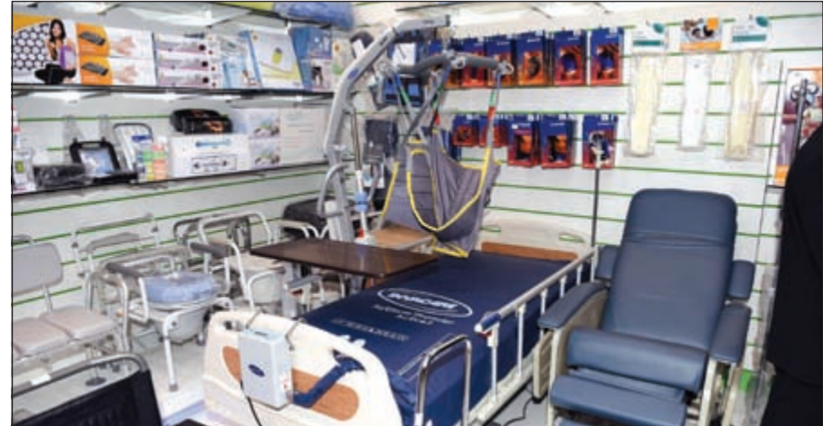
جميع المستلزمات الطبية بالجودة العالية في معرض السايير لايف كير