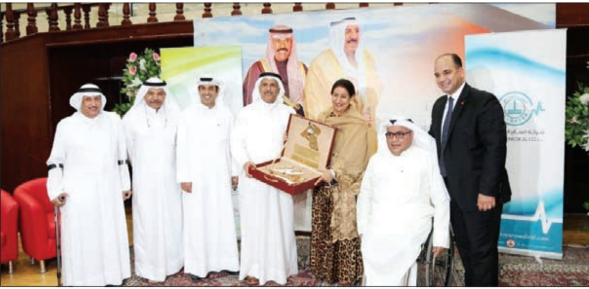
درع تكريمية من مجموعة السايير للشيخة شيخة العبدالله