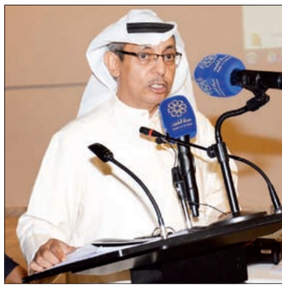
جمال اللهو ملقيا كلمته

افتتح وزير الإعلام ووزير الدولة لشؤون الشباب الشيخ سلمان الحمود ظهر امس «الثلاثاء» تدشين عدد اربع سيارات نقل تلفزيوني مع عدد عشر وحدات إنتاج تلفزيوني متنقل بمبنى الوزارة. وأكد الحمود ان هذه الخطوة تأتي من توجيهات صاحب السمو الأمير الشيخ صباح الأحمد وولي عهده الامين، كما تأتي بمتابعة دائمة لرئيس مجلس الوزراء، مفتخرا بتحويل الاوراق والدراسات الى انجازات ملموسة، مشيرا الى اهتمامه بانطلاق هذا الاسطول المتطور عالميا، بالإضافة الى الاهتمام بتدريب العنصر البشري حرصا على خدمة الاعلام الكويتي. وعلى صعيد اخر اشار الحمود الى اهمية هذه الأجهزة في النقل المباشر والربط الفضائي، لافتا إلى سعادته البالغة بمشاركة المهندسات والمشغلات الكويتيات في تشغيل هذه الأجهزة لتكون الوزارة في مقدمة الاعلام الوطني، مثنيا على جهود الوكيل طارق المزرم وقطاع الهندسة وجميع المشاركين بهذا التدشين، مؤكدا ان الانجازات لا تتحقق بالأمنيات بل بما يتم تنفيذه على ارض الواقع.