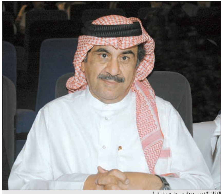
الفنان القدير عبدالحسين عبدالرضا