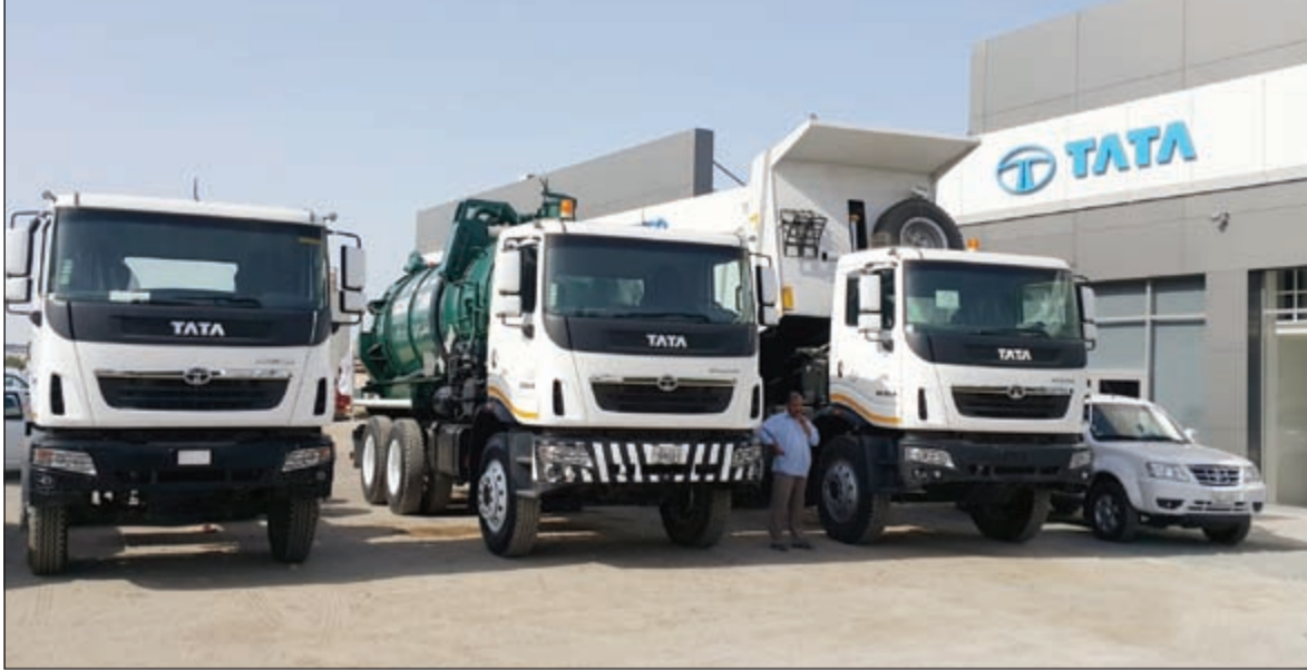
شاحنات تاتا بريما