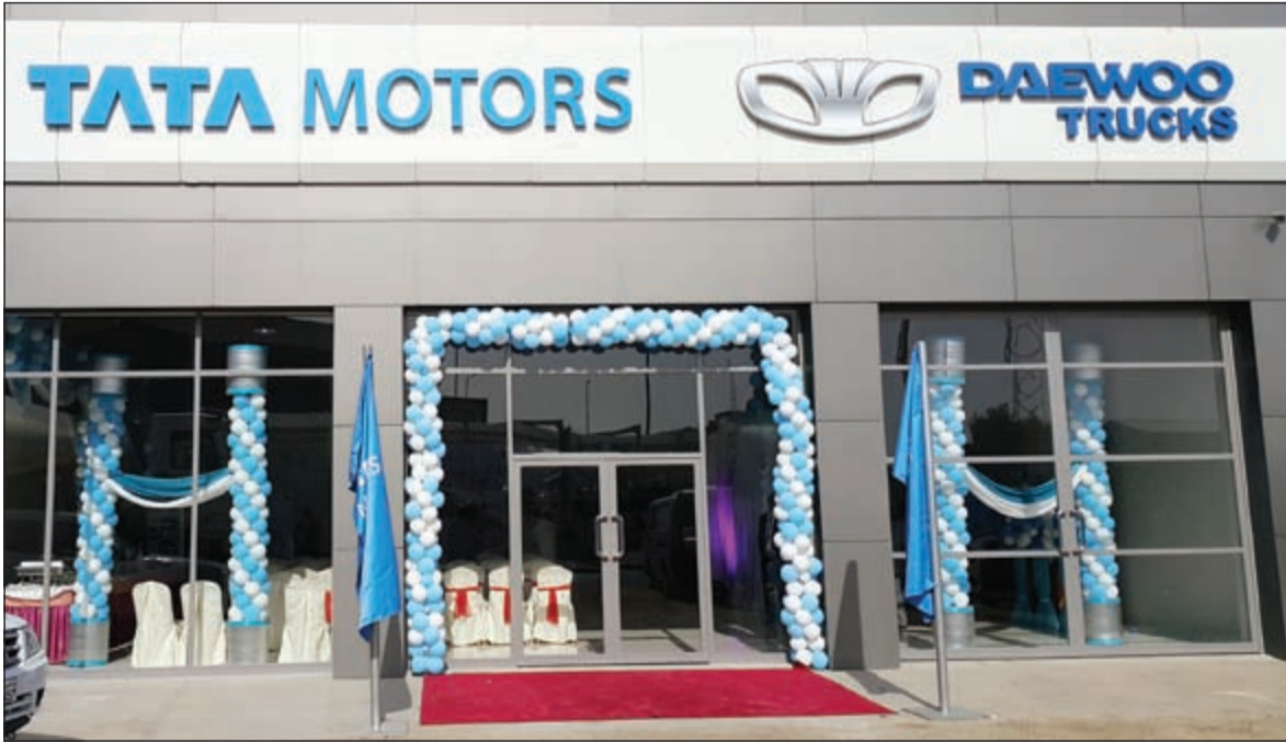
معرض تاتا الجديد