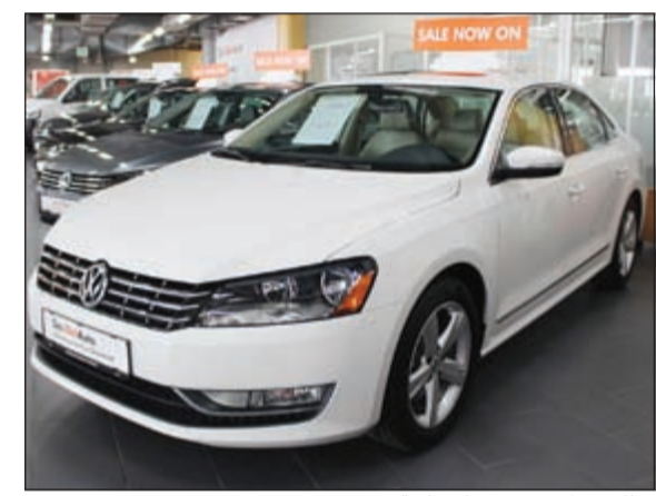
فولكس واجن جودة واعتمادية

تمنح العملاء تجربة قيادة استثنائية كالتي توفرها السيارات الجديدة