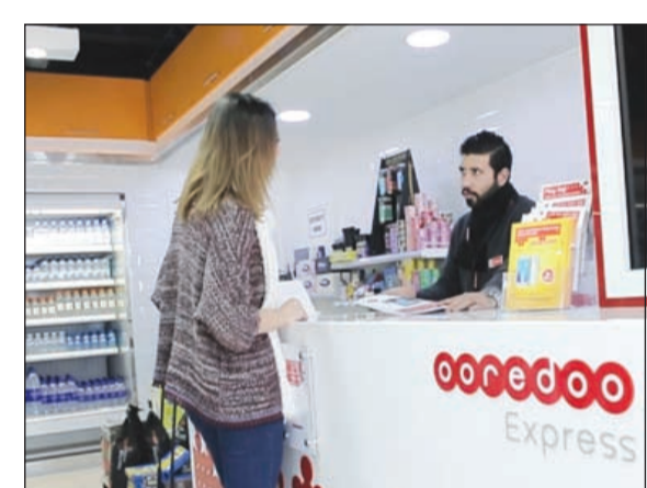
Express Ooredoo أعلى مستويات الجودة والخدمة

مدار الساعة، حيث أصبح في إمكانهم الاشتراك في مختلف خدمات الشركة وإتمام عمليات الشراء أو تسديد الفواتير وغيرها وتتماز أروبا. بعد رضا عملائنا أولى أولوياتنا كشركة وسنستعي لتلبية رغباتهم ونظراتهم بكل الطرق». يعد مركز سلطان أحد أكبر مراكز البيع بالتجزئة الرائدة، والتي تضم باقة متنوعة من البضائع والمنتجات والخدمات التي تقدمها لروادها من خلال 11 فرعًا في الكويت. كما افتتح مركز سلطان أول فروع في مسقط واستحوذ على فروع