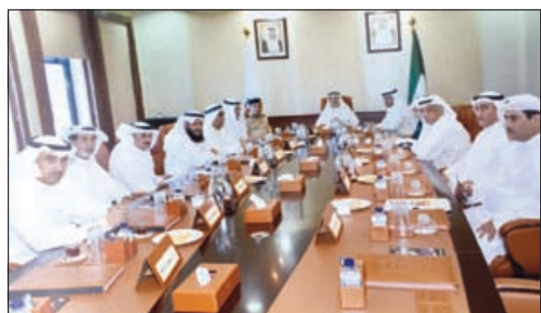
الفريق أول م. أحمد الرجيب لدى اجتماعه بممثلي الوزارات والمختارين

على المواطنين والأهالي وهنا الجميع بمناسبة قرب شهر رمضان المبارك.