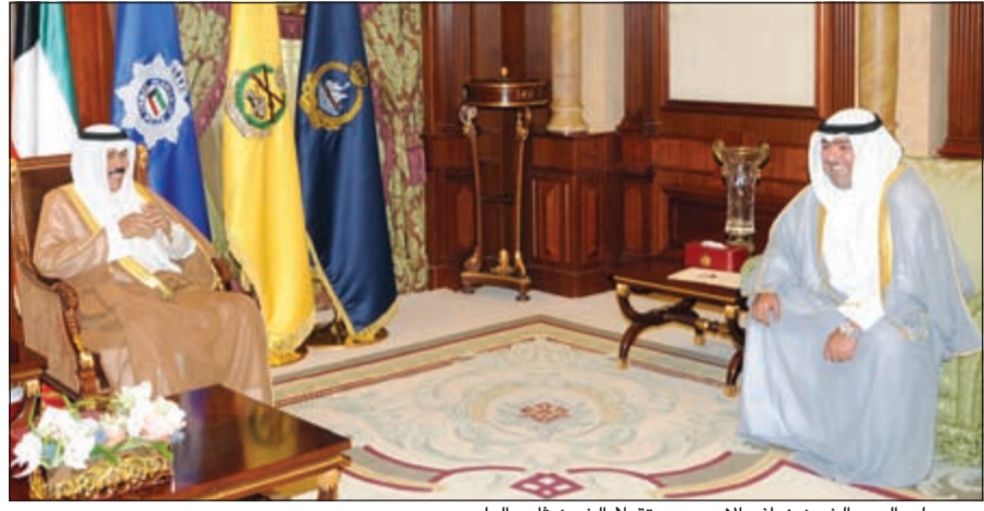
سمو ولي العهد الشيخ نواف الأحمد مستقبلاً الشيخ ثامر العلي

بحث سفيرنا لدى جمهورية أوزبكستان أحمد الجيران مع وزيرة الاقتصاد الأوزبكية قاليينا سايدوفا العلاقات الثنائية في مجال الاقتصاد وسبل تعزيزها وتطويرها. وقالت سفارة الكويت في بيان تعلقته «كونا» أمس ان السفير الجيران أكد خلال اللقاء حرص الكويت على دعم المشاريع التنموية والإنسانية في الدول الصديقة، مشيراً إلى أهمية الاستقرار والأمن الداخلي في تطور الاقتصاد ونجاح جذب الاستثمارات الخارجية. من جهتها أعربت سايدوفا عن شكرها لحكومة الكويت على دورها في تعزيز النمو الاقتصادي في أوزبكستان ولاسيما ما قدمه الصندوق الكويتي للتنمية الاقتصادية من دعم وتمويل لمشاريع التنمية فيها.