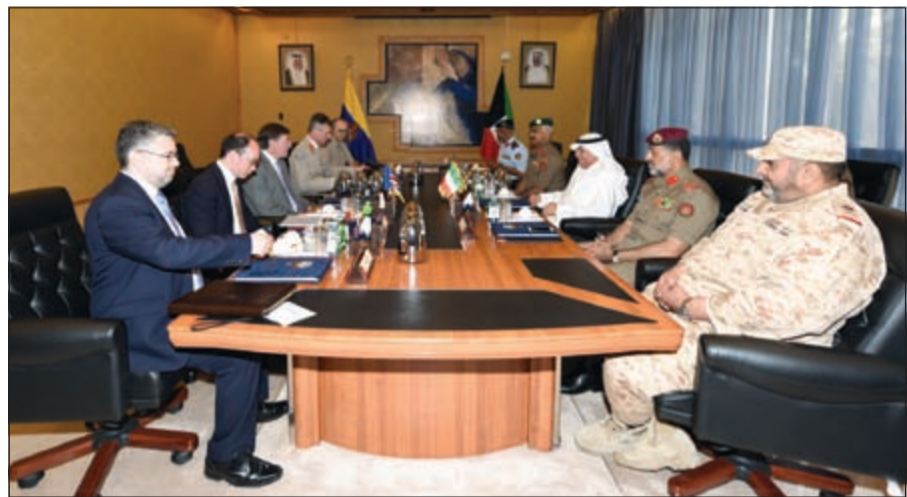
الشيخ خالد الجراح خلال اجتماعه مع فليب دون والوفد المرافق له

ومعاون رئيس الأركان لهيئة العمليات والخطط اللواء الركن أحمد العميري وأمر القوة البرية اللواء الركن خالد الصباح. كما استقبل الشيخ خالد الجراح بمكتبه في وقت لاحق من صباح أمس رئيس الأركان المشتركة للقوات المسلحة السودانية الفريق أول مهندس ركن عماد الدين مصطفى عدوي والوفد المرافق له. حيث تم خلال اللقاء تبادل الأحاديث الودية ومناقشة الأمور والمواضيع ذات الاهتمام المشترك لاسيما المتعلقة بالجوانب العسكرية وسبل تطويرها وتعزيزها بين البلدين الشقيقين. حضر اللقاء رئيس الأركان الفريق الركن محمد الخضر.