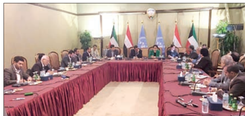
إسماعيل ولد الشيخ خلال لقائه وفد أنصار الله والمؤتمر الشعبي العام

بشأنها، آليات الانسحاب وتسليم السلاح واستئناف الحوار السياسي واستعادة مؤسسات الدولة، وكذلك الإفراج عن الأسرى والمعتقلين. وأكد ولد الشيخ أحمد أول من أمس أن مشاورات السلام اليمنية المنعقدة حالياً بالكويت تسير على الطريق الصحيح، موضحاً أن المرحلة المقبلة ستكون «حاسمة».