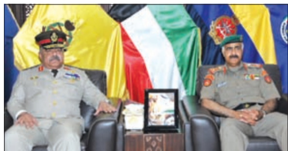
الفريق الركن محمد الخضر مستقبلاً اللواء أركان حرب أحمد وصفي

أشاد بعمق علاقات التعاون بين البلدين الشقيقين. وحضر اللقاء رئيس هيئة التعليم العسكري اللواء الركن أنور جاسم المزديدي.