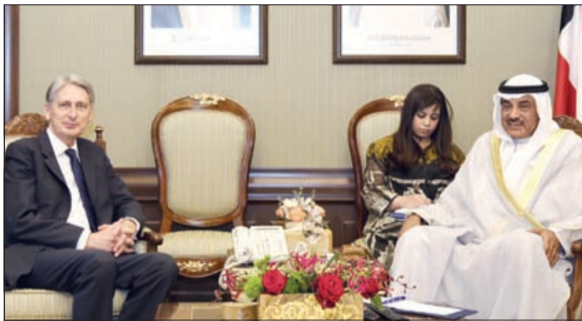
الشيخ صباح الخالد مستقبلاً وزير الخارجية البريطاني فيليب هاموند

اجتمع النائب الأول لرئيس مجلس الوزراء الخارجية الشيخ صباح الخالد مع وزير خارجية المملكة المتحدة الصديقة فيليب هاموند في قصر بيان صباح أمس وذلك بمناسبة زيارته الرسمية إلى البلاد. وتم خلال الاجتماع استعراض مجمل العلاقات الثنائية المميزة التي تربط البلدين الصديقين وسبل تعزيزها وتطويرها في كل المجالات. كما تم التباحث حول أوجه التعاون القائمة بين البلدين على كل المستويات وسبل التنسيق المشترك لمواجهة التحديات الجارية في المنطقة ومناقشة آخر المستجدات والتطورات الإقليمية والدولية والقضايا محل الاهتمام المشترك. وحضر الاجتماع نائب وزير الخارجية بالإنابة السفير وليد الخبيزي ومساعد وزير الخارجية لشؤون مكتب النائب الأول لرئيس مجلس الوزراء ووزير الخارجية السفير الشيخ د. أحمد ناصر المحمد وعدد من كبار مسؤولي وزارة الخارجية.