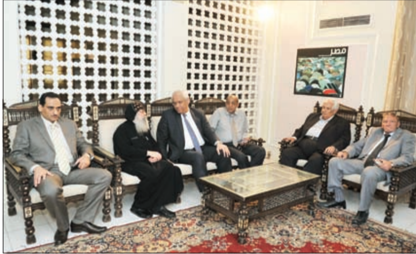
السفير المصري مستقبلاً القصص ببجول وعددا من الحضور لتقديم واجب العزاء في ضحايا الطائرة المصرية (قاسم باشا)

وقالت الوزارة أن حملة الترويج السياحي تشمل كل الدول العربية ووصفتها بأنها الحملة الأقوى التي يشهدها الشرق الأوسط تحت شعار «وبالنسبة لمبادرة السياحة الداخلية «مصر في قلوبنا» التي تنتهي اليوم الاثنين وتكلفت نحو 90 مليون جنيه، قال وزير السياحة أنه سيتم وقفها لمدة شهر خلال شهر رمضان المبارك للدراسة المتأنية لتقرير إما استمرارها أو تأجيلها أو إلغاؤها.