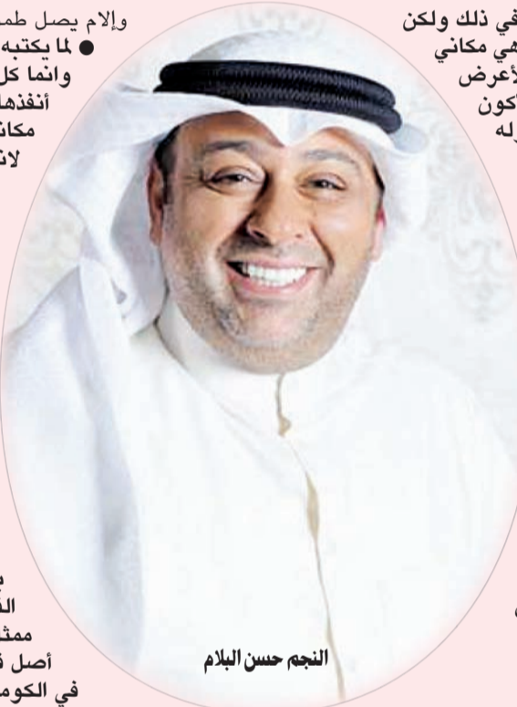
النجم حسن البلام

الكويت من خلالنا بحكم غربتهم، ووجدنا منهم التقدير