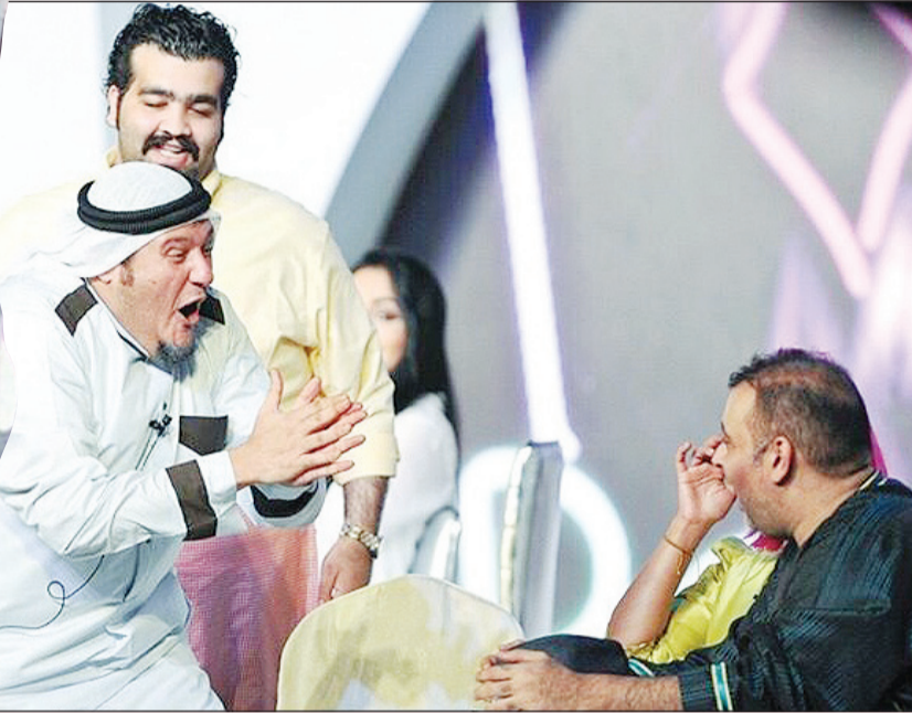
البلام في مسرحية «مر يا حلو»

«طبق عصي» على المسارح بالعيد.. وأشكر أصدقاءنا في نادي اليرموك لدعمهم الرائع