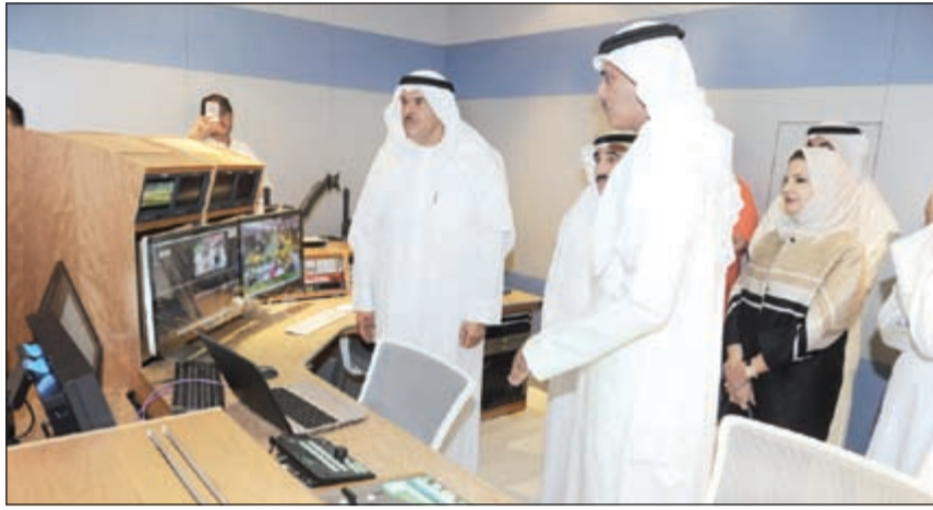
الشيخ سلمان الحمود خلال افتتاح استديوهات البث لقنوات التلفزيون «الأولى» و«إثراء» و«العربي»

وأضاف ان القطاع الخاص يعد المصدر الأساسي للعمل التنموي والخبري على مستوى العالم في حين يمثل القطاع المصرفي العمود الفقري للاقتصاد الخاص.