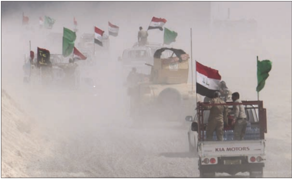
القوات الموالية للحكومة العراقية أثناء تواجدهم في منطقة تقع بين قرية السيجر والفلوجة أمس

التنظيم المتطرف، كما كشفت عن أساليب تفخيخ جديدة يعتمدها «داعش» لإعاقة تقدم القوات في الفلوجة، أثناء إزالتها للسواتر الأمامية للإرهابيين وتمشيط المنطقة من الأنغام والعبوات الناسفة. وعلى الصعيد الميداني لمعركة تحرير الفلوجة، أعلنت قيادة العمليات المشتركة أمس عن تحرك قوات «مكافحة الإرهاب» إلى مدينة الفلوجة شرقي الأنبار لتحقيق النصر الحاسم على تنظيم «داعش»، في إشارة تمهد لاقتحام مدينة الفلوجة، وهو ما حدث في عمليات تحرير الرمادي وهيت والرطبة بالأنبار. من جانبه، أكد قائد الشرطة الاتحادية الفريق رائد شاكري جودت أن قوات مغاوير الشرطة الاتحادية سيطرت على طريق الفلوجة السريع، وتمكنت من تحرير قرية «المختار»، على الطريق الدولي لمدينة الفلوجة التي يسيطر عليها داعش. هذا، وقتلت قوات الجيش العراقي القيادي في تنظيم (داعش) الإرهابي المكني «أبو عزام» في منطقة البو سجل غربي الفلوجة. كما تمكن طيران التحالف الدولي من تدمير 12 راجعة صواريخ «كاتيوشا» في