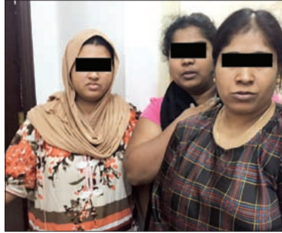
الاسوييات عضوات شبكة الرذيلة

أوقف رجال أمن الفروانية بتعليمات من مدير أمن المحافظة العميد ركن صالح العنزي شبكة مكونة من اربع وافدات يمارسن الرذيلة بوكر في منطقة خيطان وتم التحفظ على الوافدات وحوالتهن الى الحجز تمهيدا لإبعادهن عن البلاد. وقال مصدر امني ان معلومات وردت من مصدر سري يعمل لدى ادارة أمن الفروانية عن وجود مجموعة من الآسيويات يقمن بممارسة الرذيلة بمقابل مالي، وامر العميد العنزي بتشكيل فرقة لاجراء تحريات للتحقق من صحة المعلومة من قبل قائد المنطقة العقيد صالح الدعاس وتبين ان اربع آسيويات يقمن بممارسة الرذيلة بالوكسر حيث تمت مدهامته بعد استصدار اذن نيايبي، وفي التحقيقات الاولى مع الآسيويات اعترفن بأن هناك آسيويا يعمل كسمسار وجار ضبطه وحوالته الى التحقيق. وأشار المصدر الى أن رجال الامن يقومون برفع تقرير بهذا الشأن بهدف منع المتهمات من دخول البلاد مرة أخرى.