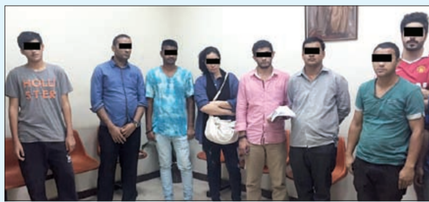
المخالفون بعد ضبطهم في المخفر

حاصلتها شخصين مطلوبين للتنفيذ الجنائي و11 وافداً مسجلاً بحقهم قضايا تغيب و4 باعة متجولين و7 عمالة سائبة وتحريير 47 مخالفة مرورية واحتجاز 6 مركبات. وفي محافظة الجهراء شن رجال امن المحافظة بقيادة مدير الامن اللواء علي ماضي حملة على عدد من مناطق وبادشرف من العقيد محمد الابراهيم، حيث تم ضبط 43 وافداً من مختلف الجنسيات مسجلاً بحقهم قضايا مختلفة باعتبارهم مخالفين لقانون الإقامة وعمالة سائبة، بالإضافة الى ضبط عدد من الوافدين المدنيين المطلوبين للتنفيذ المدني كما تم تحرير مخالفة مرورية وحجز مركبتين.