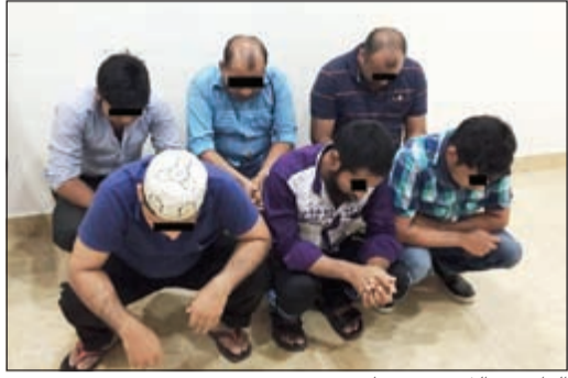
الوافدون الذين تم ضبطهم