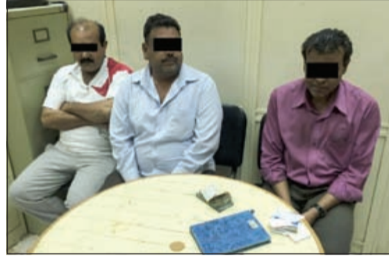
المتهمون وادوات القمار

احتجز رجال امن الفحيحيل 3 وافدين من جنسيات مختلفة بعد ضبطهم يقومون بلعب القمار داخل بقالة في منطقة الفحيحيل، وتم التحفظ على المبالغ المالية رصدها رجال الامن والادوات المستخدمة في لعب القمار وتم رفع تقرير بالواقعة. وقال مصدر امني ان معلومات وردت الى مدير امن الاحمدى عن قيام وافدين بلعب القمار داخل احدى البقالات، فتم ارسال ضباط للتحقق من صحة المعلومات بلباس مدني وتم تصوير المتهمين وطلب الدوريات التي قام رجالها بضبط الوافدين وهم من الجنسية الهندية والباكستانية والبنغالية، وتمت احوالهم الى الحجز تمهيدا لإبعادهم عن البلاد.