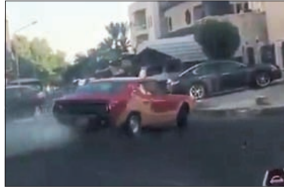
استعراض المستهتر في شوارع سلوى

تفتن مستهتر بالاستعراض بسيارته الرياضية موديل 1977 بين طرقات احدى قطع منطقة سلوى، مما ادى الى ازعاج الاهالي الذين قاموا بإبلاغ العمليات عن فعل المستهتر الذي اختفى قبل وصول الدوريات. وقال المصدر ان مستهترا قام بالاستعراض مساء اول من امس بين طرقات احدى القطع دون ان يصطدم بالسيارات المتوقفة، كما ان المستهتر لم يبال بخروج الاطفال امام المنازل، حيث تم ابلاب العمليات لكنه هرب، وجار البحث عنه. وأضاف المصدر بأن رجال المباحث قامو بتوثيق البيانات الخاصة بالمركبة التي كان قائدها يستهتر دون مراعاة لقاطني المنطقة.