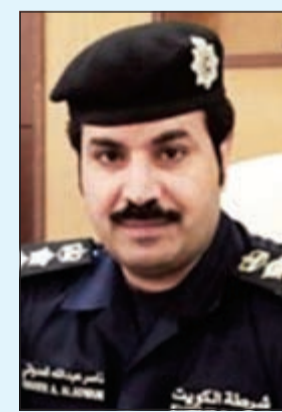
العقيد ناصر العدواني

670 ديناراً ووافدة سيلانية مسجل بحقها قضية سرقة في مخفر منطقة الروضة. وأضاف المصدر ان رجال الامن ايضا قاموا بضبط باكستاني مطلوب للتنفيذ بمبلغ 790 ديناراً وآخر هندي مدين بمبلغ 3731 ديناراً وثالث خليجي مدين بـ 730 ديناراً لإحدى الشركات كما تم ضبط