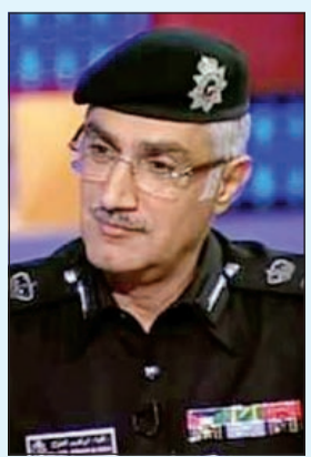
اللواء ابراهيم الطراح