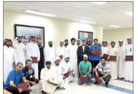
المشاركين في الدورة