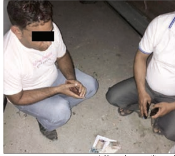
المتهمون الاسويين يلعبون القمار

في احد الساحات الترابية في نطاق المحافظة وقال مصدر امني ان إحدى الدوريات رصدت مجموعة من الوافدين مجتمعين بشكل غريب، فتم طلب الاستناد وضبطهم وتبين انهم من الجنسية الآسيوية ويلعبون القمار وتم التحفظ على النقود واوراق اللعب واحيلوا جميعا الى جهة الاختصاص.