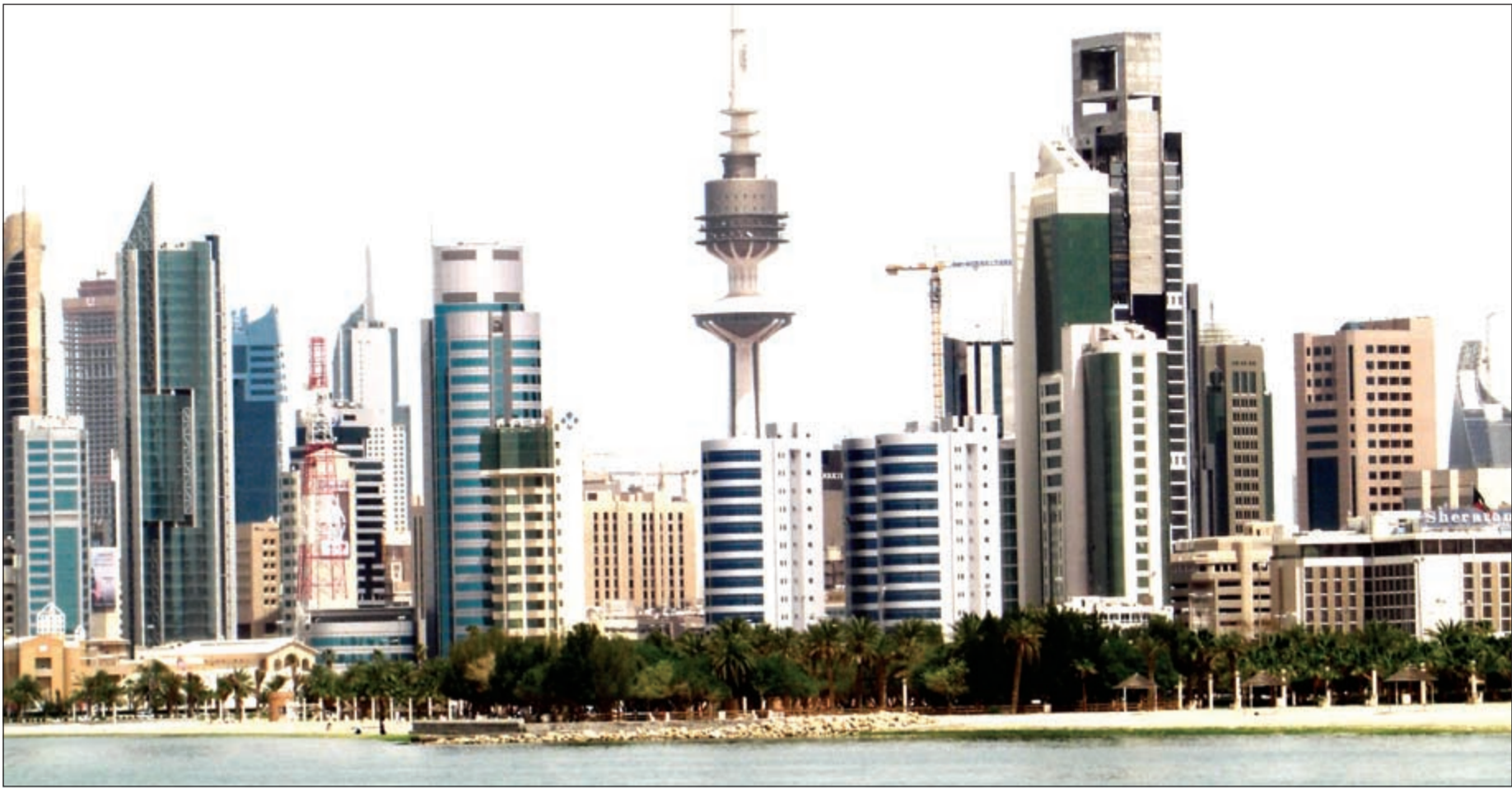
نشاط كبير في تداولات القطاع التجاري.. في الصورة منظر عام لمدينة الكويت

قال تقرير صادر عن بيت التمويل الكويتي «بيتك» أن معدل التراجع الذي سجلته التداولات العقارية في أبريل تحسن إلى 7% نسبيًا مقارنة بانخفاضها الشهري الذي نسبته 8% في مارس، وبلغ حجم الصفقات 233 مليون دينار مقارنة بـ 249,5 مليون دينار في مارس، ويأتي هذا وسط ارتفاع ملحوظ لقطاعات «الاستثماري والتجاري» في أبريل وتراجع تداولات السكن الخاص مقارنة بالشهر السابق له، إلا أنه قد ارتفعت قيمة الصفقة على مستوى القطاعات بشكل ملحوظ كما ارتفعت قيمتها في القطاعين السكني والتجاري، فيما انخفضت قيمة الصفقة من العقار الاستثماري في أبريل مقارنة بقيمتها في مارس، بينما على مستوى مقارنة الأداء السنوي انخفضت التداولات في جميع القطاعات باستثناء التجاري الذي زاد بشكل ملحوظ.