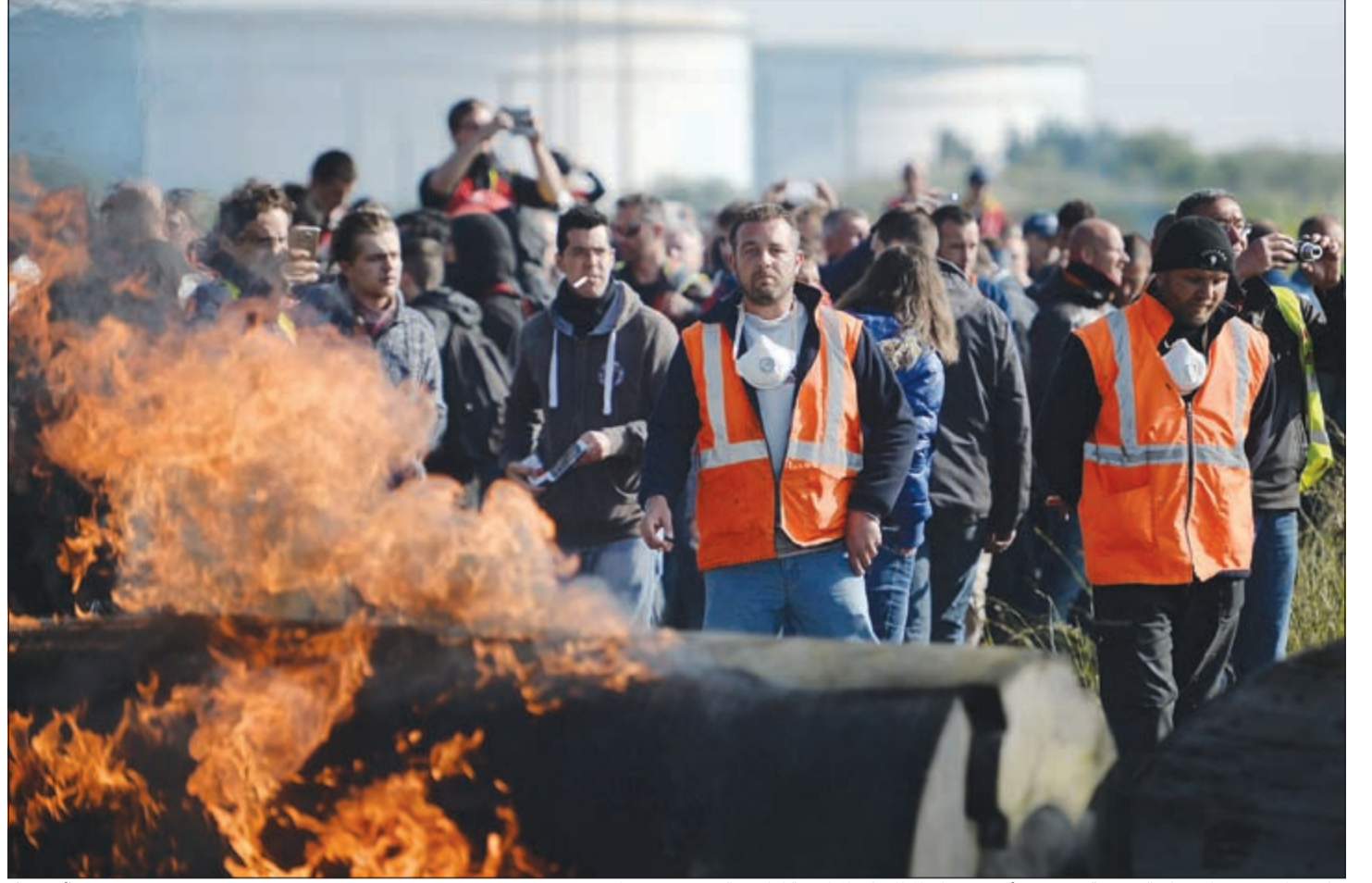
عمال نفط في مصفاة توتال الفرنسية يضربون أمس في ظل المظاهرات المناهضة لقانون العمل في فرنسا

ونشر باحثون من المركزي السعودي ورقة بحثية الشهر الماضي - قبل ترقية الخلفي - تؤكد أن الإبقاء على الربط ربما يكون النهج الأمثل للمملكة في المستقبل القريب لكنها لمحت إلى أن المملكة قد تحتاج لتغيير هذه السياسة إذا تغيرت الظروف الاقتصادية.