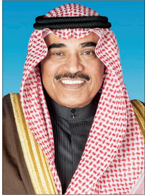
الشيخ صباح الخالد