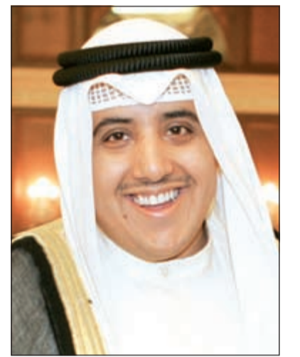
الشيخ د. احمد ناصر المحمد

عنده الأمين حفظهما الله ورعاهما. وقدم السفير الإيراني في البلاد علي رضا غنايتي تهانيه للزميل الراشد وقال في برقية بعث بها: تلقيت بالغ السرور نيا انتخابكم نائبا لرئيس اتحاد الصحفيين العرب خلال انتخابات اتحاد الصحفيين العرب في مؤتمر العام الثالث عشر الاستثنائي الذي عقد في تونس، وإنني إذ أهنئكم بهذه المناسبة وأدعو الباري العلي القدير أن يسد خطاكم ويوفقكم في مسؤولياتكم الجديدة.