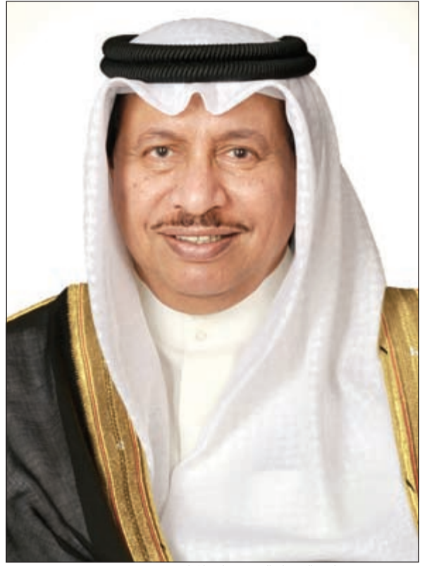
سمو رئيس مجلس الوزراء الشيخ جابر المبارك

تلقي عددا من برقيات التهنئة من كبار المسؤولين في الكويت والعالم العربي