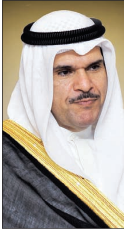
الشيخ سلمان الحمود