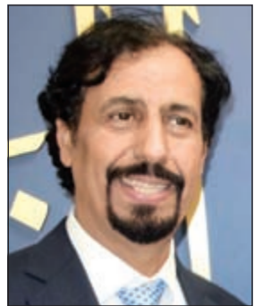
الشيخ علي الخالد

الأمير الشيخ صباح الخالد ورعايته للأجيال الشابة. وتقدم السفير بهذه المناسبة بالتهنئة الى وزير الإعلام ووزير الدولة لشؤون الشباب الشيخ سلمان الحمود والقائمين على الجناح لظهور واقع نهضة الكويت وانجازاتها وتوصيل رسالتها الحضارية. وأعرب عن اعتزازه بالجهد الكبير والعصر المتغير في انجاز الجناح بعقول وآيد شبابية مبدعة من مهندسين ومصممين وفنانين وطلاب ودارسين بتنوع تخصصاتهم، مشيرا الى بصمة المرأة الكويتية المبشرة في مواصلة