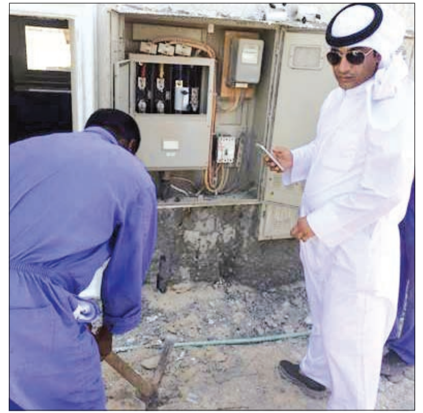
العامل الفني يقوم بمهمته في قطع التيار عن أحد البيوت المخالفة

العراي أكد في أول مهمة له بعد توليه إدارة بلدية المحافظة أن البلدية جادة في تطبيق القانون على المنازل المخالفة