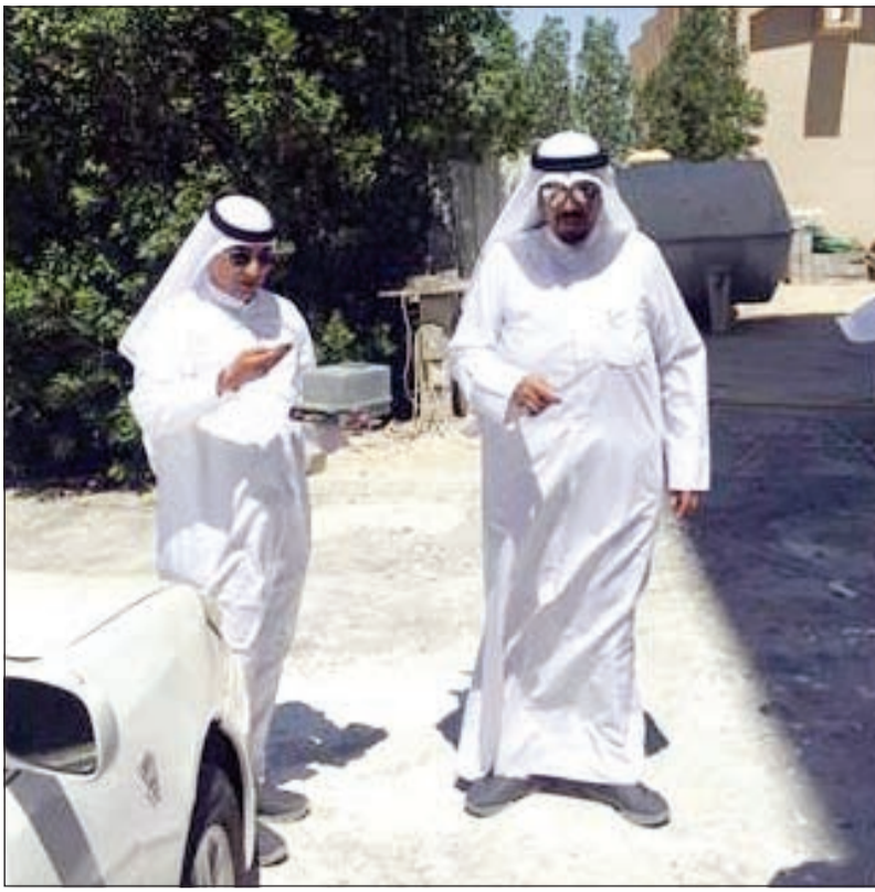
جولة على البيوت المخالفة