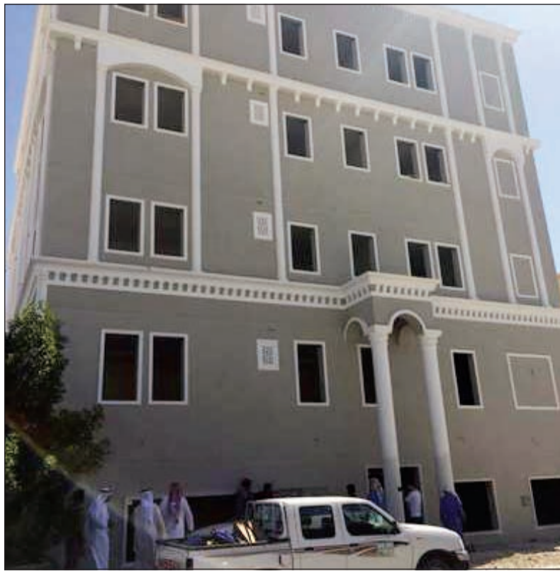
أحد البيوت المخالفة