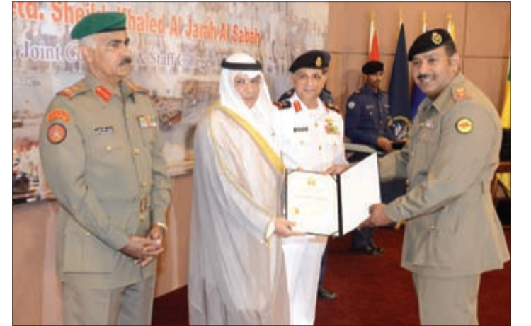
الشيخ خالد الجراح مكرماً أحد الخريجين

أكد نائب رئيس مجلس الوزراء وزير الدفاع الشيخ خالد الجراح أمس أن مستوى كلية مبارك العبدالله للقيادة والأركان المشتركة يواهي أرقى الكليات الأكاديمية للعلوم العسكرية في العالم. جاء ذلك في كلمة للمشيخ خالد الجراح خلال حفل تخريج دورة القيادة والأركان المشتركة رقم 20 الذي أقيم في كلية مبارك العبدالله. وقال الوزير الجراح: إن القيادة العسكرية في وزارة الدفاع حريصة على مواصلة تطوير الكلية ودعمها لتحقيق جميع الطموحات، معرباً عن الفخر والاعتزاز بما وصلت إليه الكلية من مستوى متطور. وأضاف أن وجود عدد كبير من الضباط الدارسين من جيوش الدول الشقيقة والصديقة يؤكد رقي مستوى التعليم الأكاديمي الذي وصلت إليه الكلية، متمنياً للخريجين كل التوفيق والنجاح في حياتهم العلمية والعملية. من جانبه، قال أمر الكلية