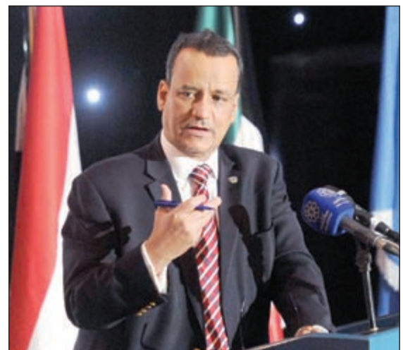
إسماعيل ولد الشيخ أحمد متحدثاً خلال المؤتمر الصحافي

الدولي الذي يبرهن عن وحدة صف استثنائية ودعم لامتتاه لجهود الأمم المتحدة. وردا على سؤال حول الجهة التي تعتقد أنها تعرقل المشاورات «ما نراه اليوم ونفهمه أن هذه المشاورات تمر بمرحلتها وكل طرف له الحق أن يعبر بقوة عن مواقفه لاسيما الاندماج التام للثقة بين الأطراف مما يتطلب وقتاً لإعادة تلك الثقة والانخراط في حوار بناء ولكن لم نر إلى الآن إلا بوادر لتفاهم ودعم كبير من الأطراف بالرغم من العراقيل». وفيما يتعلق بعمل لجنة التهدئة والتواصل أكد عودة ممثلي وفد انصار الله والمؤتمر الشعبي العام إلى العمل في اللجنة بعد تعليق ليوم واحد، مؤكداً أن اللجنة «مستمرة في عملها بجدية». فيما نبحت حالياً في عدة خيارات لدعم عمل اللجان المحلية وتعزيزها من الناحية التقنية. وعن مدى صحة تطرقه في إحاطته أمس لمجلس الأمن إلى سحب السلاح من طرف انصار الله وتقديم هذه الخطة على كافة الخطوات، أكد أن لديه خطوات مبدئية مشجعة تقضي بالقرام الجميع بهذه الخطوة، وأن المشاورات تطرقت إلى خطوات وترتيبات تنفيذ هذا الأمر عبر مشاورات طويلة مع الطرفين والجميع ملتزم بهذه القضية. وفيما يخص الضمانات لكلا الطرفين، قال ولد الشيخ: في البداية كنا نركز على البناء وهذا يأخذ وقتاً وقد لاحظنا في عملية بناء الثقة أن هناك