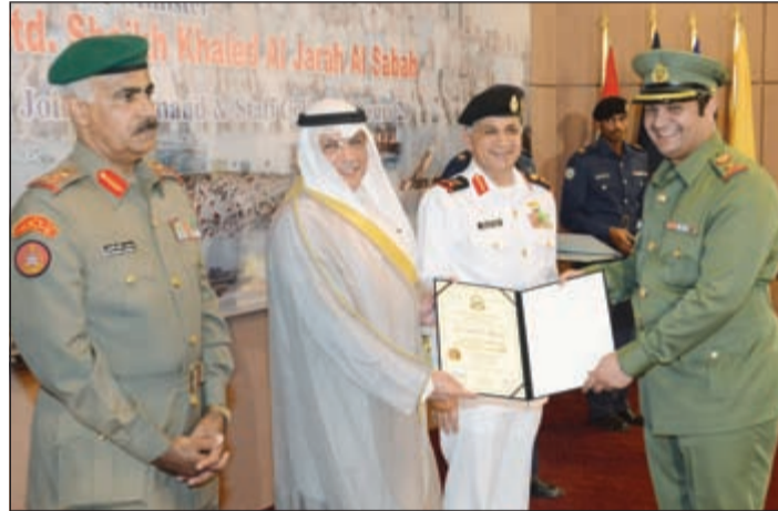
أحد ضابطي الحرس الوطني يتسلم شهادة تكريمه