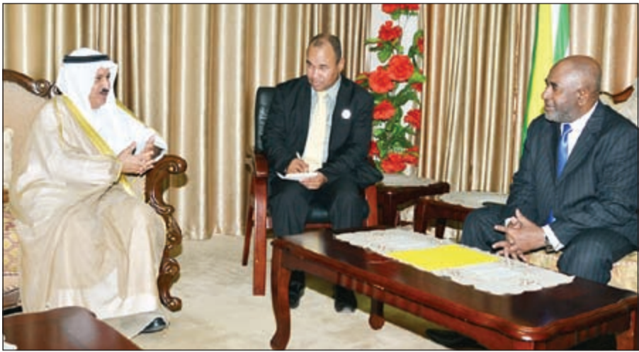
الرئيس عثمان غزالي مستقبلاً محمد صيف الله شرار

استقبل الرئيس عثمان غزالي رئيس جمهورية القمر المتحدة الشقيقة ظهر أمس ممثل صاحب السمو الأمير الشيخ صباح الاحمد، المستشار بالديوان الأميري محمد صيف الله شرار، وذلك في قصر بيت السلام بالعاصمة موروني. وقد شارك شرار ممثلاً عن صاحب السمو في حفل تنصيب عثمان غزالي رئيساً لجمهورية جزر القمر المتحدة.