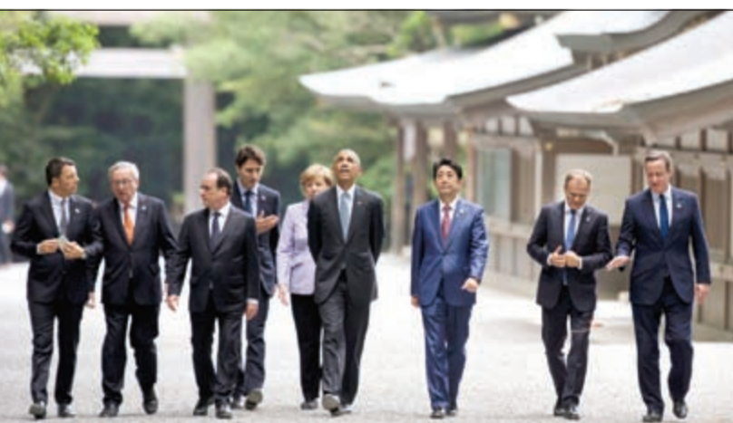
الرئيس الأميركي باراك أوباما وقادة دول مجموعة السبع الكبرى خلال جولة لهم على هامش قممهم في اليابان أمس

الديمقراطيون يتهمونه بالإفادة من أزمة الرهن العقاري أوباما يصف ترامب بـ «الجاهل والمتعجرف»