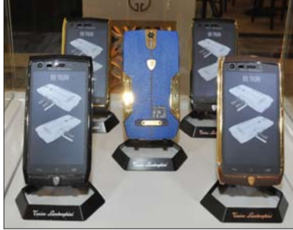
مجموعة الهواتف الذكية الجديدة