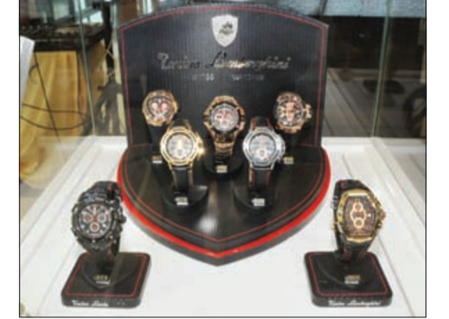
من مجموعة الساعات الجديدة