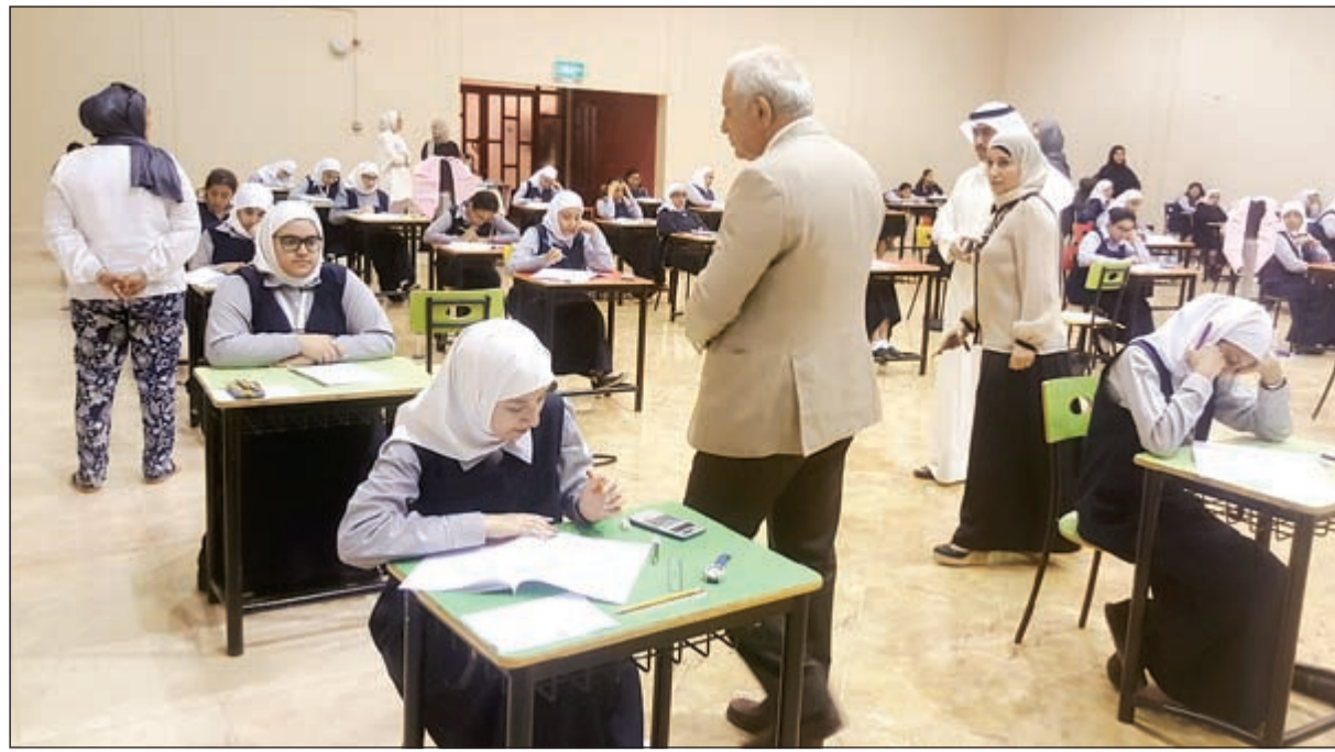
العيسى داخل إحدى لجان الاختبارات