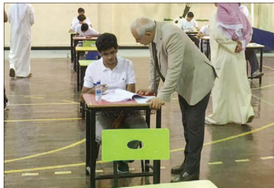
د. العيسى يتحدث إلى أحد الطلبة

قال وزير التربية وزير التعليم العالي د. بدر العيسى ان الوزارة حريصة على القضاء على حالات الغش بكل الطرق والوسائل، لافتا الى ان حالات الحرمان بسبب الغش بلغت حتى الآن نحو 200 حالة خلال الاختبارات الحالية. جاء ذلك عقب جولة تفقدية امس على لجان ثانوية جاسم الخرافي بين بقرطبة وبيان للبعثات، مبينا ان الاختبارات شهدت طرقا مبتكرة في حالات الغش من أبرزها السماعات الصغيرة. وأوضح العيسى ان الوزارة تحاول جاهدة ان تتبّع أي طرق حديثة للغش والوسائل المستخدمة الا انه مع كل مره تظهر طرقا اخرى، الا اننا سننقذ لها بالمرصاد ولن نسمح بها. مشيرا الى انه قد تكون هناك حالات لم يتم اكتشافها حتى الآن الا ان الجهود تبذل لرصد اي طرق مبتكرة يقدم عليها الطلبة وستكون لهم بالمرصاد. ولفت الى اهتمام الوزارة بالحالات الخاصة، مشيرا الى