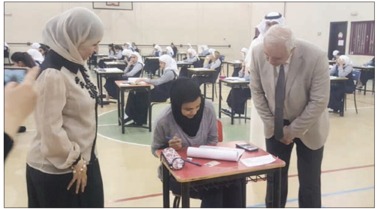
د. بدر العيسى يتابع إحدى الطالبات خلال الاختبار

العيسى تفقد لجان اختبارات الثانوية العامة وأكد أن الوزارة تحاول تتبع الطرق الحديثة للغش