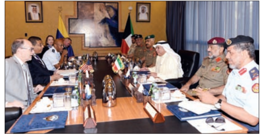
الشيخ خالد الجراح مستقبلاً مساعد وزير خارجية الولايات المتحدة الأمريكية لمراقبة التسلح والتحقق والامتثال فرانك روز

بين البلدين الصديقين وحرص الطرفين على تعزيزها وتطويرها. حضر الاجتماع رئيس الأركان العامة للجيش الفريق الركن محمد الخضر ونائب رئيس الأركان العامة للجيش الفريق الركن عبدالله النواف ومعاون رئيس الأركان لهيئة الاستخبارات والأمن اللواء الركن عبدالرحمن الهودود ومعاون رئيس الأركان لهيئة العمليات والخطط اللواء الركن أحمد العميري وأمر القوة الجوية اللواء الركن طيار عبدالله يعقوب الفودري.