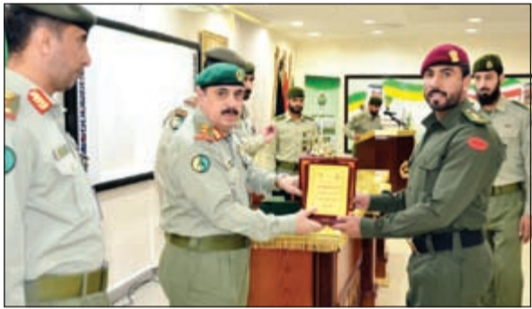
الفريق الركن م.هاشم الرفاعي خلال تكريم أحد الضباط

يقفوا عند حدود ما تعلموه خلال الدورة من علوم نظرية وتدريبية عملية، بل ينبغي مواصلة تطوير الذات من خلال التحصيل العلمي واكتساب الخبرات من القيادات. من جانبه، ألقى مدير مديرية التعليم العسكري المقدم الركن ناصر يعقوب الشطي أوضح فيها الحرس على إعداد ضباط الحرس الوطني بما يتلاءم مع مقتضيات العصر ومستجدات الفكر العسكري ومستحدثاته في كافة الشؤون الأمنية والعسكرية، من خلال مناهج تميز بين العلوم العسكرية والأكاديمية، يتولى تدريبها ذوو الكفاءات التدريبية المتميزة الذين يبذلون قصارى جهدهم في عملية الإعداد والتأهيل، حتى يكون الضباط على مستوى المسؤولية الملقاة على كاهلهم، كل في وحدته.